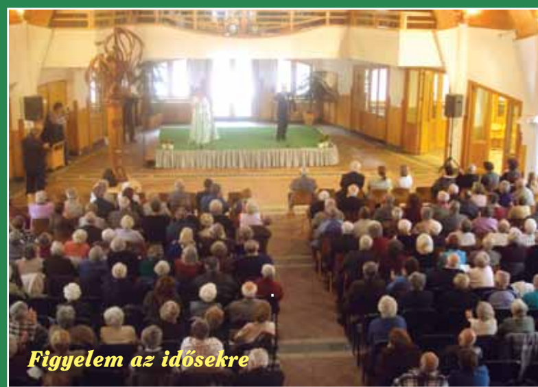
Figyelem az idősekre