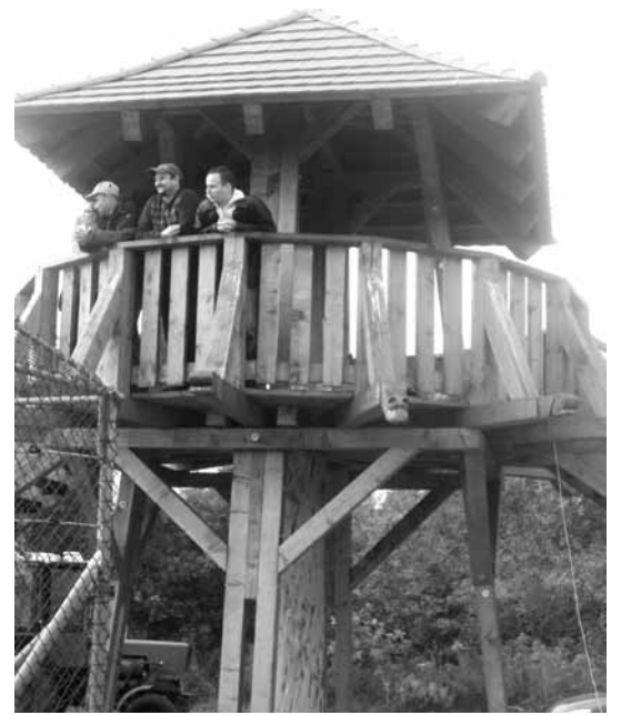
Vendégek a kilátón

Kifelé menet még fülembé csengtek az igazgató szavai: „A 17. állatkert vagyunk Magyarországon, de Medveotthonként ez Közép-Európa egyetlen látogatható intézménye.” Igazi kuriózum, amire büszkék lehetünk.