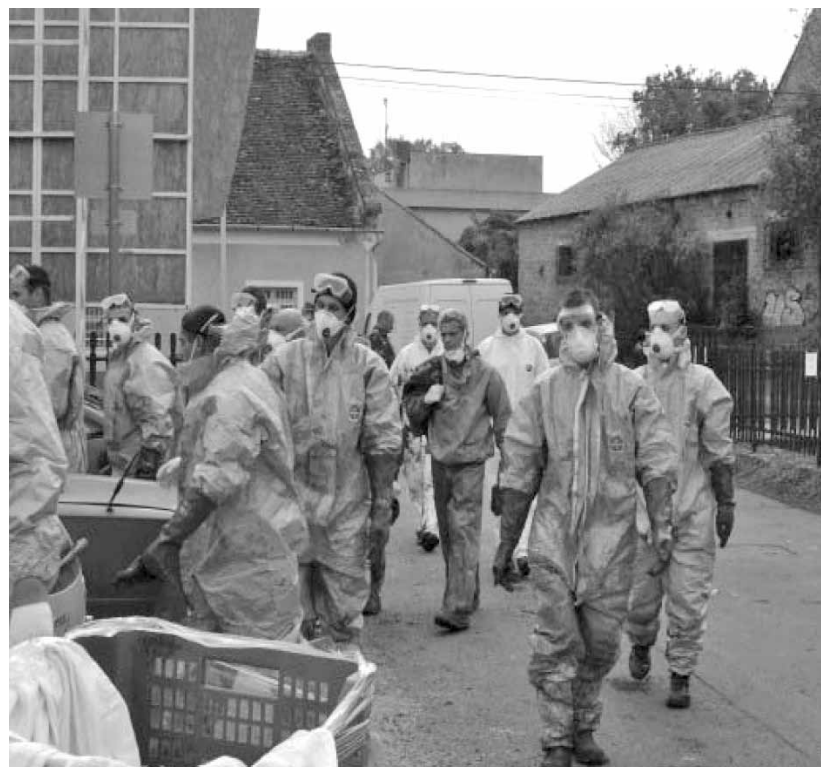
Katonák, vöröslő védőruhában