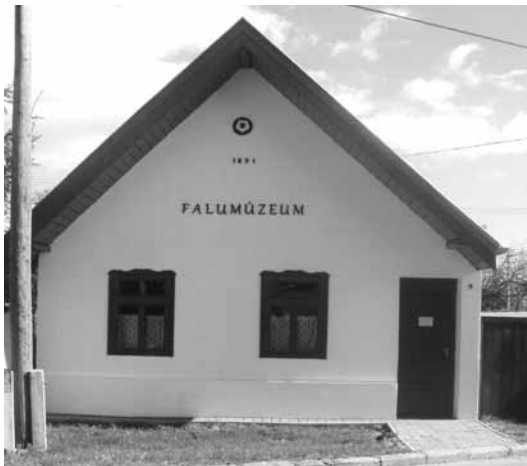
A Falumúzeum épülete Csomádon

ló helyiségek kialakítására lesz mód, így közel 100 gyereket tud majd fogadni az intézmény. A kivitelezési közbeszerzési eljárás már zajlik. Felkészülünk további pályázatok benyújtására is, megvannak a terveink például járda építésére a biztonságos gyalogosközlekedés érdekében, a