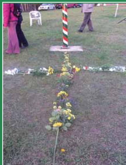
Gyarapodott a Hősök Parkja