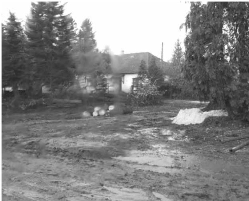
Ez a kép fogadott Devecserben

Megérkeztünk Devecserre. Rendőrök állják el utunkat, és kérdezik jöve-telünk célját. Elmondjuk, hogy kik vagyunk és kivel beszéltük meg. Addig, amíg várunk, hogy továbbmehessünk, pár fotót készítek, hogy lássa majd egyszer az unokám, milyen szörnyű következménye lehet a felelőtlen döntésnek, egy emberi mulasztásnak. Körülöttünk vöröslük minden - munkagépek jönnek mennek tolják, lapátolják az iszapot és a földet. Ekkor elküldenek a polgármesteri hivatalhoz, hiszen most mindent onnan irányítanak. Ott már egészen gyors lenne minden, ha meglenne a lista, amin rajta van a jelentkezésünk, de végül minden megoldódik. Elkerülünk az iskolaudvarra, amelyet nem olyan régen újíttottak fel. Ez egy aprócska domb tetején van, honnan a kilátás a kastély parkra nyílik, de ott csak vörös fák törzsét, elsodort kerítést és vörös földet látunk, melyet már elkezdtek felszedni. Rengeteg itt az ember. Jönnek-mennek a kocsik, hozzák-viszik a megfáradt, vagy éppen egy kicsit pihentebb embereket, önkénteseket. Mindenkin védőöltözet és maszk, az arcuk ki se látszik. De felcsillan a szemük, amikor azt mondjuk, hogy nekik főzünk egy tál meleg Jókai bablevest.