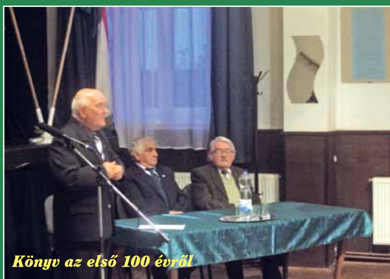
Könyv az első 100 évről

Igazi multság volt szeptember 25-én Csomádon, a művelődési ház avató ünnepségén. A szépen felújított és kibővített intézménynek egyformán örült minden helybéli, és együtt élvezték a színvonalas kulturális programokat.