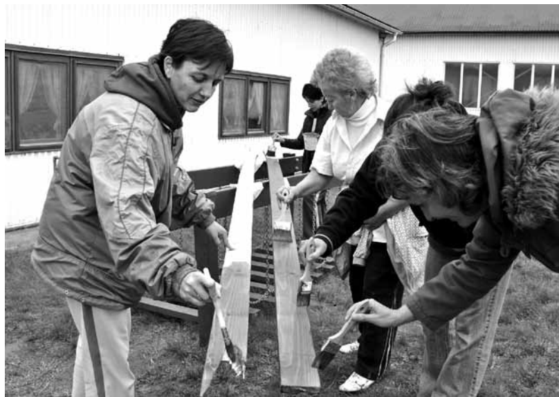
A dolgozóknak köszönhetően megszépült a játszótér