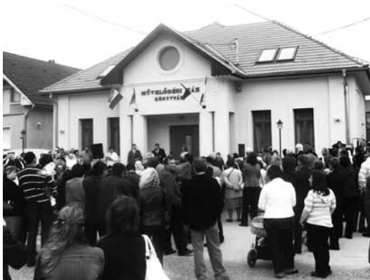
A művelődési ház

- A következő négy éves programban is legfontosabb, hogy a régi és új intézményeink stabilan működjenek. Tavasszal kezdjük az óvoda beruházás 2. ütemének megvalósítását, amelyre 96 millió forint pályázati támogatást nyertünk. Ebben az ütemben még egy foglalkoztató, tornaszoba, udvari árnyékoló, és a szuterénben kiszolgáló