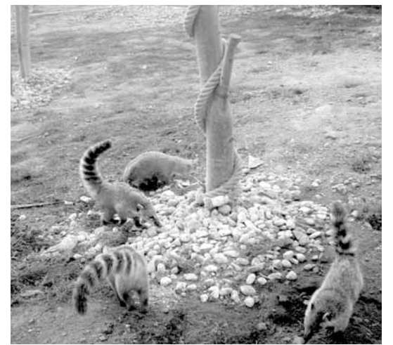
Az újonc ormányos medvék