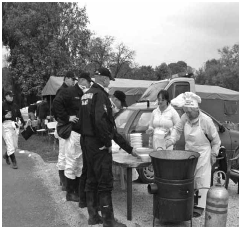
Mindenkinek jólesett egy tál étel

Közben a mi levesünk is készül – mi ezzel a tál meleg étellel tudunk segíteni. Meg egy szívből jövő mosollyal, amit most mindennél többre értékelnek. Eljött az ebéd ideje, és megjöttek a segítők, akik kinn voltak takarítani. Van, aki nyakig vörös, van, aki csak derékig, de annak a hátán is vörös iszap csillog nedvesen. Örülnek, hogy kész az ebéd, és várják, hogy ehessenek, hiszen nehéz ez a munka. Jönnek az ott lakók is, ki ételhordóval ki csak egy tányérral. Hálálkodnak nekünk, egy kis családnak, akik nem tettünk semmi egyebet, csak egy tányér meleg ételt adtunk mindenkinek.”