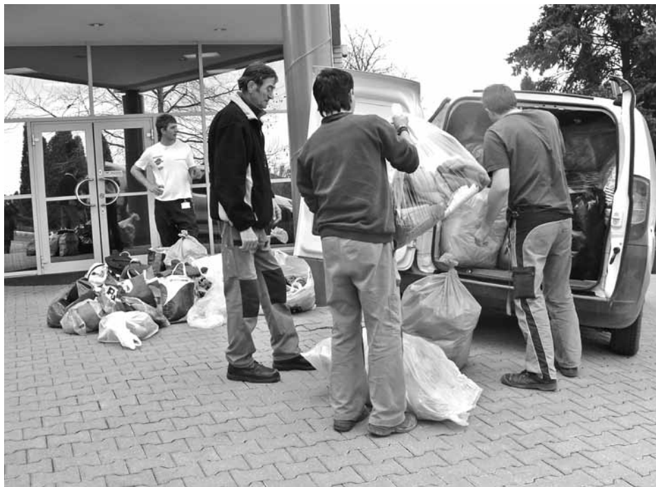
Indulnak a segélycsomagok Dévára

A közelmúltban a legnagyobb bajba a devecseri, kolontári iszapkatasztrófa károsultjai kerültek, akikért összefogtak a cég magyarországi gyárai, és olyan adományt juttattak el számukra, amely a legnagyobb segítség lehet a szakszerű kárelhárításban, mentésben: védőfelszereléseket, az iszapot semlegesítő anyagokat. Október 16-án a vállalat különítménye személyesen vitte el a küldeményt Devecserre.