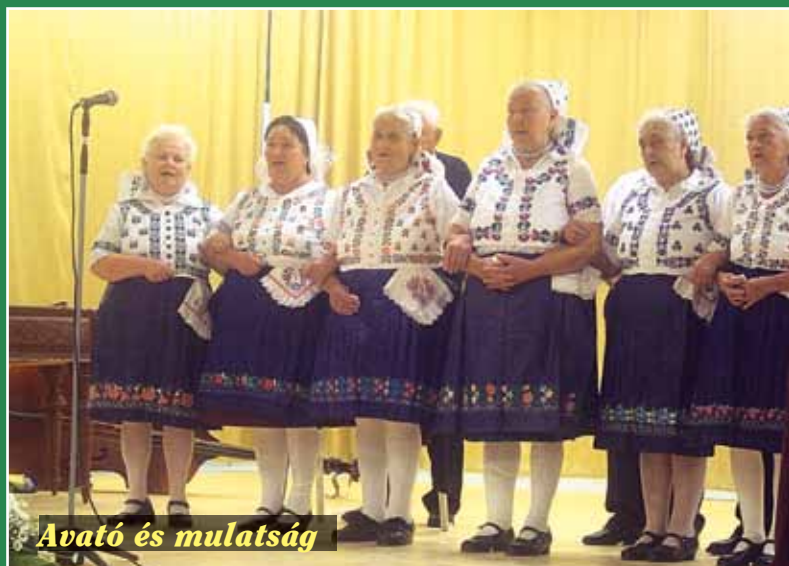
Avató és multság