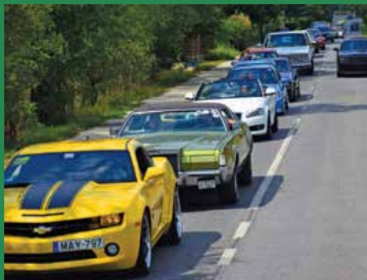
Felvonulás Erdőkertes központjában

Gyönyörű idő várta az érdeklődőket, már délelőtt több mint száz jármű érkezett melynek nagy része fel is sorakozott a déli felvonuláshoz. Rendőri biztosítás mellett a konvoj a szokásos útvonalat járta be: Fő út – Géza utca – Fő út – Vörösmarty utca – Fő út. Az Ifjúsági Táborba való visszatérés után megkezdődtek a programok és játékos vetélkedők.