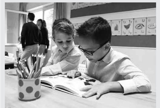
Az első osztályosok

Szeptember 3-án a város legújabb intézménye, a Jövő iskolája is megnyílt a Köves utcában, a művelődési ház szomszédságában, ünnepélyes keretek között, hiszen ez volt az első alkalom, hogy diákokat fogadhattak. A térség oktatási palettája újabb színnel gyarapodott, egy csapat kisiskolás pedig már itt tanulja meg, milyen is egy iskola. Sok sikert kívánunk az új intézménynek!