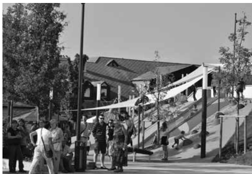
Városháza helyett játszótér és színpad épült Gödöllőn

a Petőfi utca felé egyfajta „zöld zárást” kapott a Szabadság tér, új növényekkel szabadtéri színpaddal és olyan lakossági igényt kiszolgáló egységek létesítésével, mint a nyilvános illemhely és pelenkázó, illetve itt kaptak helyet színpadot kiszolgáló helyiségek is. A dombnak ezt a hátsó részét zöld növényfal illeszti be a térbe. Az új közösségi terület átadó ünnepségére az idei Belvárosi Napok alkalmával került sor.