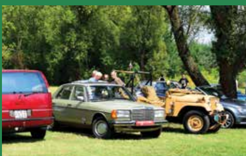
Pihenőben a járgányok

Ezután kiosztották az autós szépségverseny díjait, majd a kipufogó hangnyomás következett, ahol szintén meglepő eredmények születtek; egy gyári kisbusz például túlszárnyalta az egyik épített versenyautót.