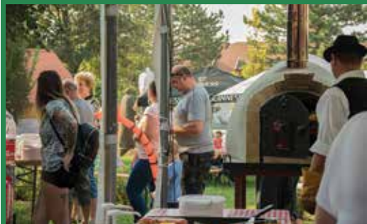
A kemencékben kiváló sörkorcsolyák készültek