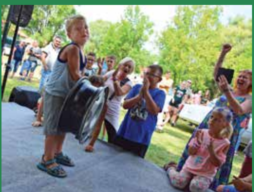
Erő, izom, felni tartás