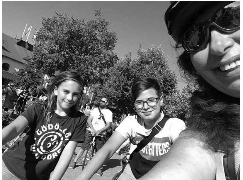
A Gurulós napon a szerző is kerekezik

Ha autóval visszük őket, a biztonsági övet és a gyermekbiztonsági rendszert mindig használni kell! A tanítás előtti napokban az iskolába vezető utat járjuk be együtt és gyakoroljuk akár gyalogosan, akár kerékpárúton haladva.