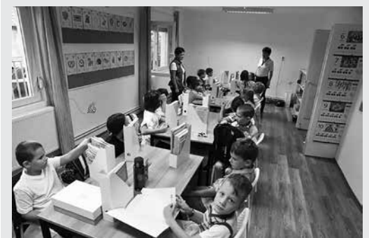
A tanító nénikkel