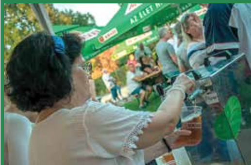
Egész hétvégén működtek a sörccsapok

A három napon át zajló eseménysorozat legfőképpen a sörökről és sörfészeségekről szólt, amiket bő választékban és frissen csapolva fogyaszthattak az érdeklődők – a megmaradt sört a rendezvény után olcsón kiárusították -, illetve szórakozhattak is. Volt sörívő verseny, koncertek és utcabál, a fellépők között pedig olyan ismert nevek is szerepeltek, mint Janicsák Veca vagy Takács Nicholas, aki pár éve még a víz nagykövete-ként funkcionált, de úgy látszik, ezúttal a sört sem vetette meg.