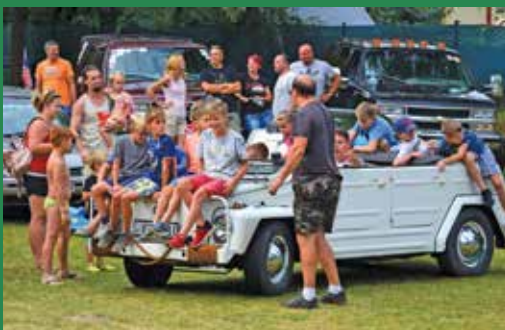
Egy jó autó sokat elbir

A felni tartó versenyen szinte csak gyerekek indultak, így a hangulat már az elején teljesen felkorbácsolódott. A kicsik és nagyobbak óriási komolysággal és erőfeszítéssel versenyeztek, melyeket a zsűri értékelt.