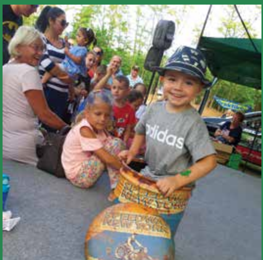
A legkisebbek is találtak szórakozást

A felni tartó versenyen szinte csak gyerekek indultak, így a hangulat már az elején teljesen felkorbácsolódott. A kicsik és nagyobbak óriási komolysággal és erőfeszítéssel versenyeztek, melyeket a zsűri értékelt.