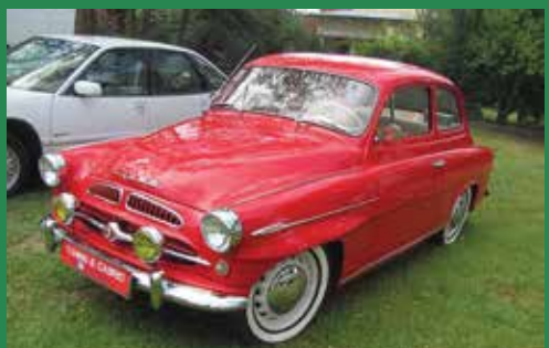
Egy klasszikus szépség a múltból