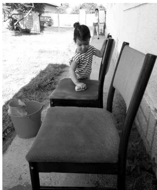
A kistesó is segíthet csinosítani az iskolát

- A hosszú szünet után fontos, hogy „beállítsuk” a gyerek belső óráját az iskolakezdésre. Ne kelljen hirtelen belecsöppennie a korán kelésbe, hanem fokozatosan, legalább egy héttel korábban már szoktassuk hozzá, hogy időben bújjon ágyba, és akkor keljen, amikor majd az iskolaévben is ébrednie kell. A kicsiket, főleg az elsősöket úgy is hozzászoktathatjuk az iskolához, hogy arrafelé sétálunk vele, elpróbáljuk, milyen lesz majd reggelente a suliba járás. Közben beszéljünk arról, mi fog történni az iskolában, és a szülő elmesélheti a saját kisiskolás emlékeit, beszélhet neki a régi tanító nénijéről, a nagy kirándulásokról, arról, hogyan talált új barátokat az iskolában, a lé-