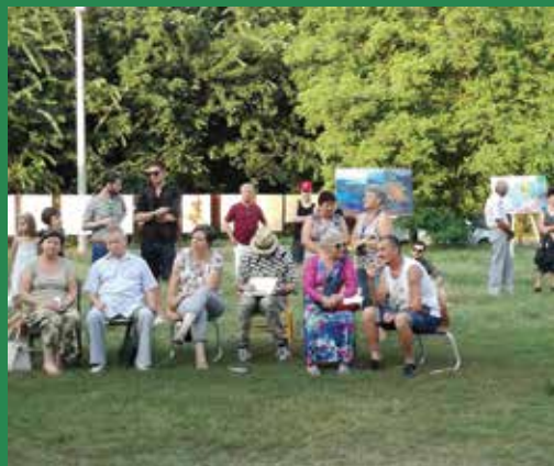
Művésztelep, záró kiállítás