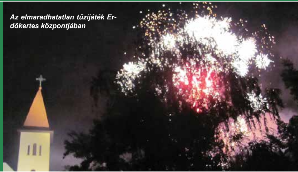
Az elmaradhatatlan tűzijáték Erdőkeres központjában