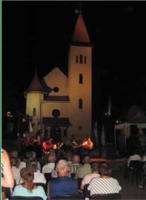
Estébe nyúló koncert a Szent István parkban

Augusztus 20. a legmagyarabb ünnepünk – legalábbis egy külföldi nehezen értené meg, hogy ezen a napon egyszerre emlékezünk az államalapításra, ünnepeljük az első királyunk, Szent István neve napját, és szegjük meg az új kenyeret, ami már az idén learatott búzából készült. Összetett ünnep ez,