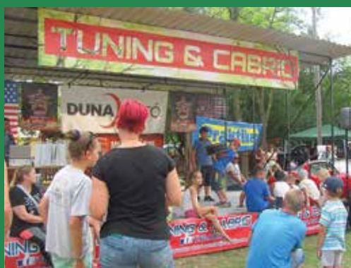
A színpad mindenkié

Erdőkertesén nyár vége felé már hagyománya van a különleges autócso-dák és oldtimerek felvonulásának és bemutatójának. Ebben az esztendőben augusztus 25-én gördültek végig a település főutcáján a járgányok, hogy az Ifjúsági Táborban leparkoljanak, és minden érdeklődő megcsodálhassa őket. Árúrok, büfé és gyermekjátékok is szórakoztatták a közönséget.