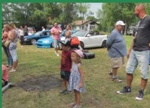
Autócso-dák és csodálók