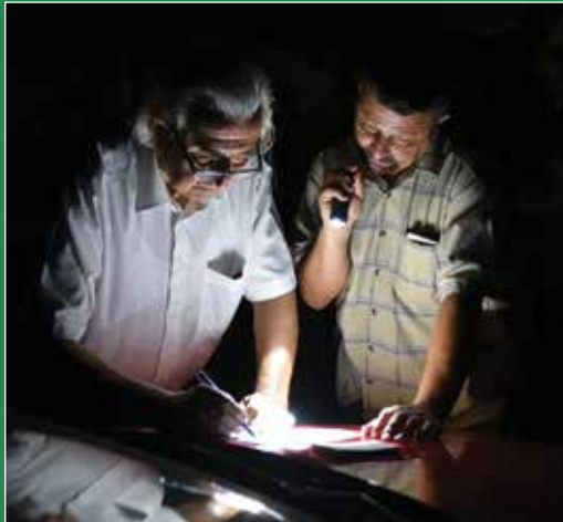
Az egyik állomásfőnök ezúttal is a polgármester úr volt

amiből ki-kiválaszthatja, ami igazán fontos a számára. „Szent Istvánkor” – fogalmazott nagyapám, ha augusztus 20-ra tervezett valamit, de a nyolcvanas években még csak úgy hívtuk az iskolában, hogy „az új kenyér ünnepe”. Azt azonban jól tudjuk, hogy ezen a napon okunk van az öröme, és tulajdonképpen azt ünnepeljük, hogy itt vagyunk, és élünk.