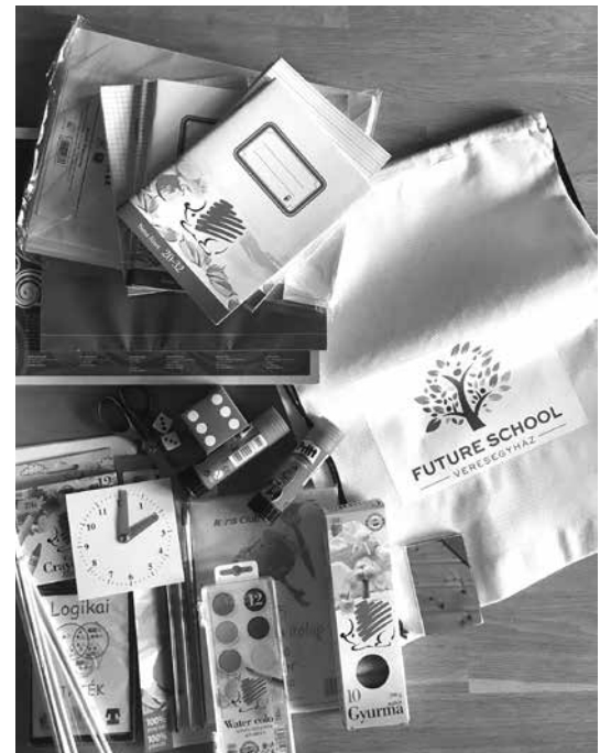
Az iskola ajándék-kezdőcsomagja az elsősöknek