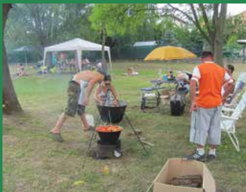
Mi rottyog a bográcban

A leghagyományosabb nyári étel okán is létrejött egy fesztivál: augusztus 19-én lecsó rottyogott a bográcokban az erdőkertesi Ifjúsági tábor területén. Az egyedi receptek szerint készült finom-