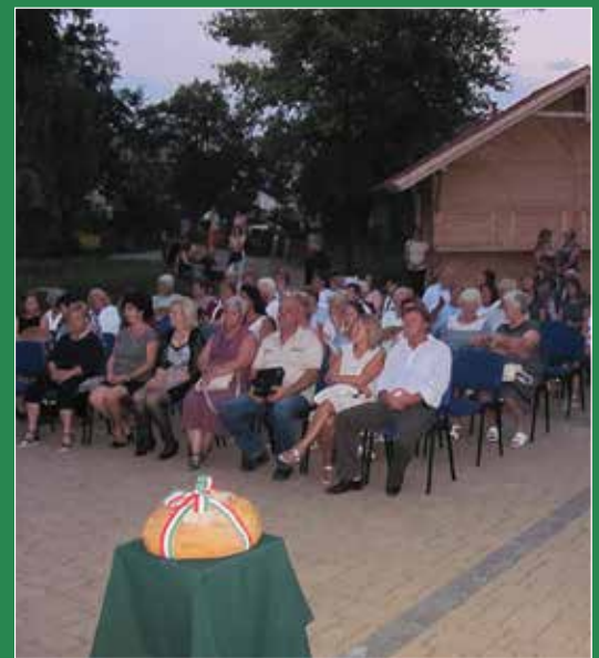
Új kenyér és ünneplők Erdőkertesen