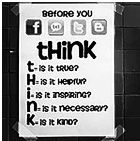
Ezeket kell mindig mérlegelni. Gondolkodj!