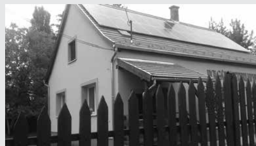
Napkollektorok és szigetelés került a csörögi hivatal épületére

beruházást hajtottak végre, amely nem igényelt önrészt, és amelynek révén korszerű és energiatakarékos módon szigetelést és napelemeket kaptak a középületek. Képünkön a megszépült önkormányzati hivatal, amelynek fenntartása gazdaságosabb lesz a felújítást követően.