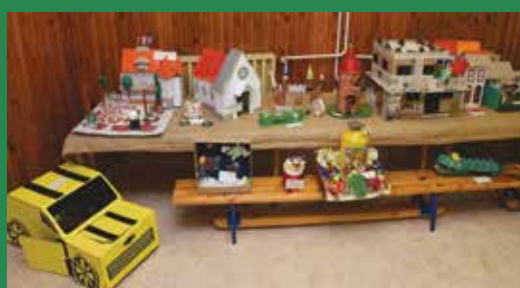
A Városháza megmintázva