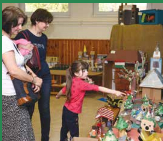
A látogatók kalauzolója