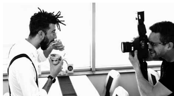
A nap képe

A sajtóeseményen részt vevő sztárvendégeket anekdotázásra csábította a finom, ízesített kávé, amit a háttérben szakértő baristák készítettek el a vendégeknek. Zalatnay Sarolta elmesélte, hogy régi barátnőivel még mindig rendszeresen találkoznak egy kis csevegésre, kávézásra, és hozzátette, hogy szívesen kipróbálják majd a különféle ízeket.