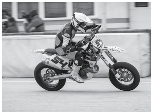
Ilyen egy supermoto futam

- Önmagában az utcai motorozást veszélyesnek tartottam mindig is, ezért zárt pályákon próbálgattam a tudásom, és hogy mikre képes a gép alattam. - idézi fel motorversenyzői karrierje kezdetét. - Nem kellett hozzá sok idő, egyből beleszerettem az így megismert motorversenyek világába. 4 éve kezdtem el verse-