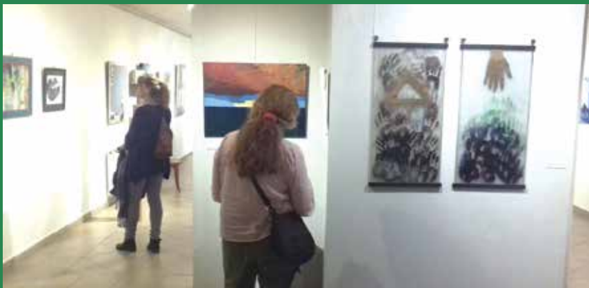
Alapos tanulmányozásra készítetnek az alkotások