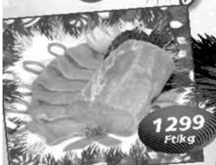
Friss sertéskaraj filé

Aldott, békés, boldog, karácsonyi ünnepeket kívánunk