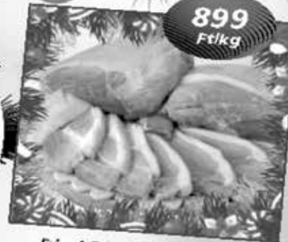
Friss bőrös comb-lapocka

Karácsonyi ponty vásár az akváriumból a tőlünk megszokott legjobb áron!