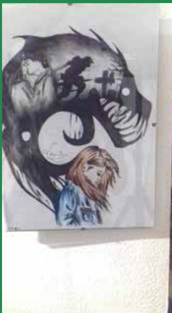
A hiány egyik képi megfogalmazása

Mindenki valami mást hiányol az életből, de vajon észrevesszük-e, hogy másnak mi hiányzik? Ez a kérdés merült fel a látogatókban, miközben a veresegyházi Udvarház Galéria legújabb tárlatának megnyitóján kiállított műveket nézegették. Akvarellek, montázsok, textilek, kerámiák, kisplasztikák, és a képzőművészet különböző válfajai kísérelték meg megjeleníteni a nehezen elképzelhetőt.