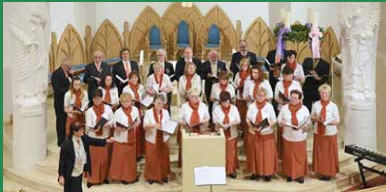
A Cantemus kórus 40 éves