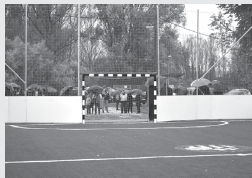
Az új mácsai sportlétesítmény