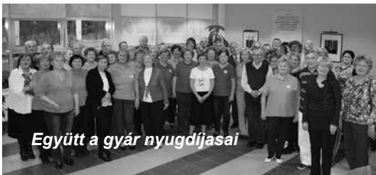
Együtt a gyár nyugdíjasa

Egy olyan cégnél, ahol a szakmaiság mellett a jó emberi kapcsolatok is természetesen jelen vannak, a közös, munkával eltöltött évtizedek valódi közösséggé kovácsolják a dolgozókat. Hiába megy nyugdíjba valaki, továbbra is a csapathoz tartozónak érzi magát, persze csak akkor, ha erre a vállalat is kellő figyelmet fordít, és nem engedi el az aktív állományból kikerülő kollégák kezét. Ezt a szokást követi a Sanofi veresegyházi gyára, ahol a november 17-én megtartott nyugdíjas találkozó minden mozzanata azt tükrözte: a telephely és nyugdíjasai kölcsönösen törődnek egymással, és továbbra is összetartoznak. Nemcsak azért, mert érkezéskor rögtön köszönés után mindenki azt kérdezte a másiktól, „hogya vagy?”, és aztán figyelmesen meg is hallgatta a választ, hanem, mert nyilvánvalóan érdeklődtek hajdani munkahelyük hírei iránt.