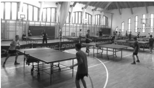
Küzdelem a megyei döntőbe jutásért