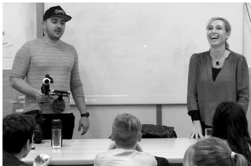
A Vloggersuli vidám pillanata

Természetesen sokkal előrébb járnak mind a jó, mind a rossz trendekben Amerikában. Ott már olyan előrehaladott volt például az internetes zaklatás mértéke, hogy az iskolákban nagyon komoly, kötelező oktatás a zaklatás elleni harc, a megelőzés, a védekezés eszközei. Itthon is fontos lenne ez az iskolákban. Nemcsak a tanároknak, sokszor a szülőknek sincs fogalma arról,