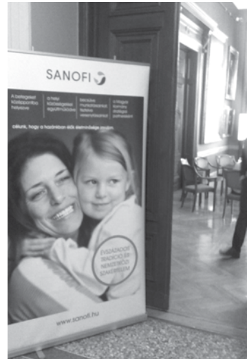
A kezdeményezés támogatója a Sanofi