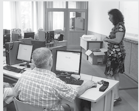
A nyugdíjaskor is lehet aktív - képünkön egy időseknek szervezett számítástechnikai tanfolyam résztvevői ismerkednek az internettel

Kistérségünkben Veresegyházon, a Kölcsey Ferenc Városi Könyvtárban korábban már zajlott kifejezetten idősek számára szervezett számítógép