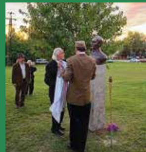
Kiss Ernő altábornagy szobrának felavatása