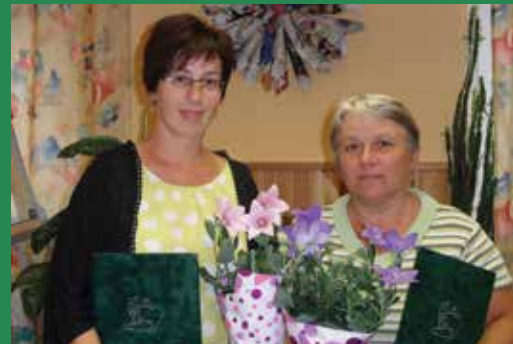
A két kitüntetett