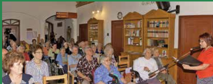
Idősek napi rendezvény az Idősek Otthonában

Október 14-én Sulibörzén mutatkoztak be ismét a környék középfokú tanintézményei a Mézesvölgyi Általános Iskolában.