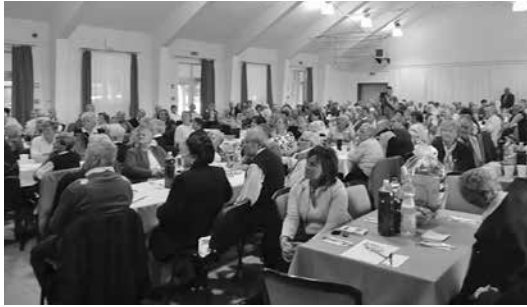
Idősek Világnapja a Kistérség nyugdíjasainak ezúttal Vácrátóton

A köszöntések és az ajándékok átadása után a Fővárosi Operettszínház kiváló művészei, Dancs