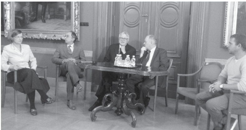
Kerekasztal beszélgetés a sajtó képviselőivel