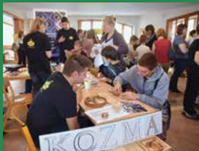
Idén is nagy érdeklődés övezte a Sulibörzét a Mézesvölgyi Általános Iskolában