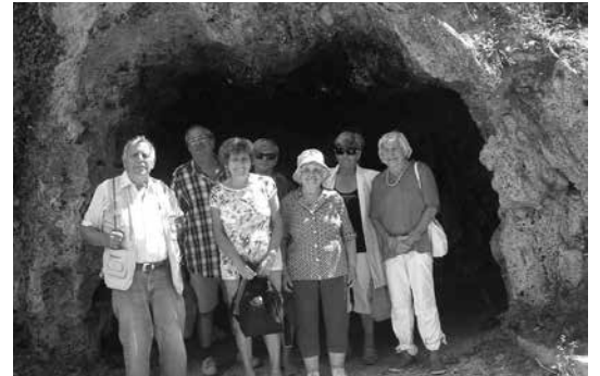
Kirándulás a barlanghoz