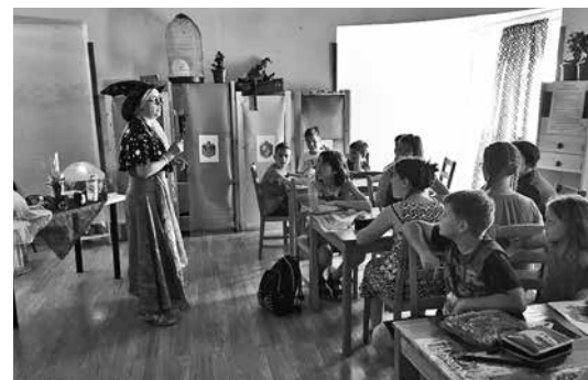
Jóslástan Trelawney professzorral