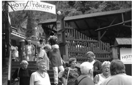
Pihenő az étteremben

Rövid várakozás után fakultatív sétára indultunk, és már az idő is kedvezett, így szép napsütésben fedeztük fel Lillafüred szépségeit: a Kastély szállót és csodás környezetét, függőkertjeit, a sebesen száguldó Szinva-patak csobogóit, a kisvasút