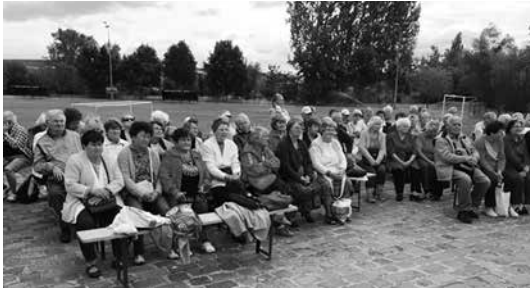
A közönség és a fellépők is remekül érezték magukat