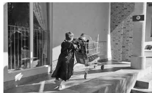
Irány a 9 és háromnegyed számú vágány