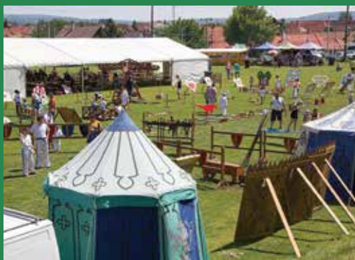
Benépesült a csomádi sportpálya a falunapon