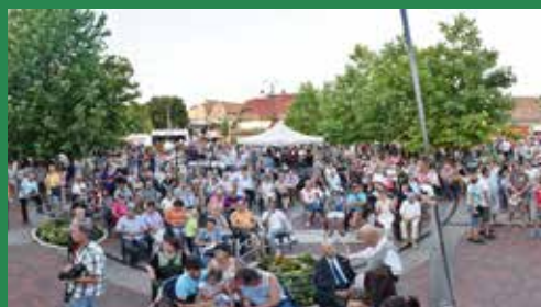
Telt ház a főtéren, a városünnepen

Fanatic zenekar, szombaton pedig Nagy Feró lépett színpadra.