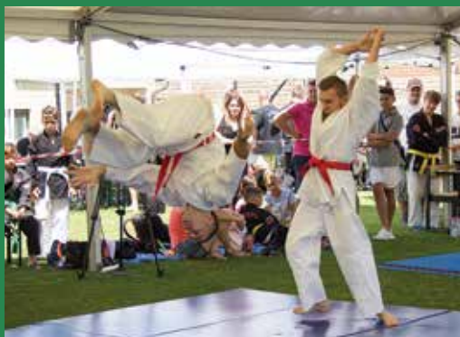
A Csomádi Falunapon évről évre rangos nemzetközi harcművészeti fesztivál és verseny is zajlik

Június 30-án és július 1-jén ünnepelte meg Veresegyház várossá avatásának 18. évfordulóját. Ennyi idő alatt a településnek vannak már saját születésnap hagyományai, mint például a vasútmodell kiállítás a Mézesvölgyi Általános Iskolában vagy a főzőverseny, amely a Városháza előtti téren zajlik.