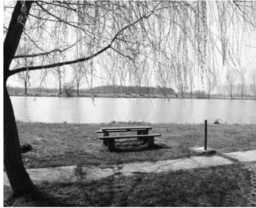
Az órbottyáni horgásztó

lást szervezni a környékükön. Veresegyházon a Haldorádó és a Pamut-tó, Órbottyánból Vác felé haladva a bottyáni tó, Váckisújfaluban a horgásztó megér egy kiruccanást!