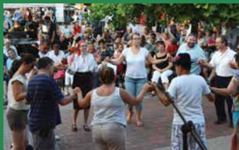
Családi táncház a téren