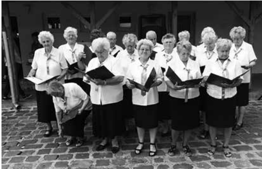
Műsor a nyári találkozóon