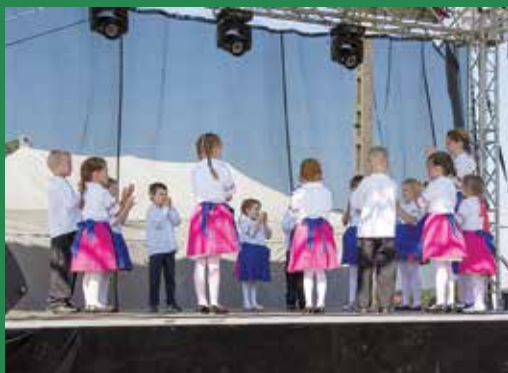
A legkisebbek műsora a színpadon