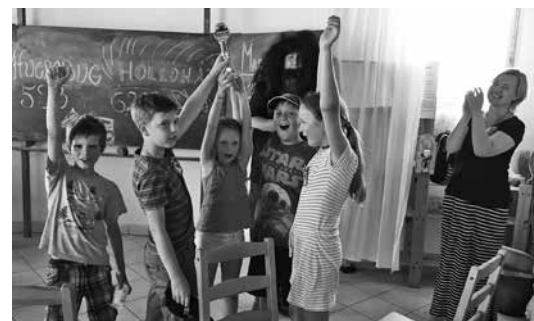
Eredményhirdetés, győzött a Hugrobug