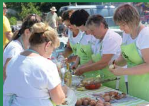
A városévforduló elmaradhatatlan programja a főzőverseny