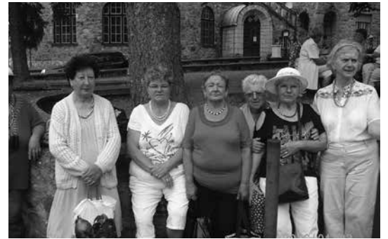
A híres Palota Szálló előtt