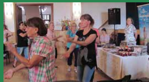
A mozgás sem maradhatott el egy egészségről szóló hétfégen