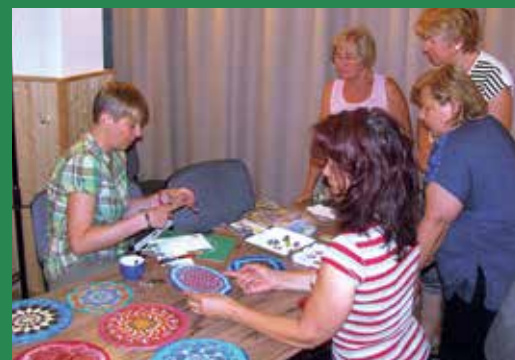
Kis kézműveskedés a Kertesnessen

Július 15-16-án a testi-lelki egészség állt az érdeklődés középpontjában az első ízben megrendezett KertesNess fesztiválon Erdőkertesen. Az egészségtudatos hétfégen számos hasznos előadáson, foglalkozáson, tornán vehettek részt az érdeklődők, az esemény bővebb összefoglalóját Kultúra rovatunkban olvashatják.