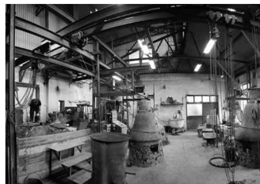
A veresegyházi Szentlélek templom harangja is az órbottyáni műhelyben készült.