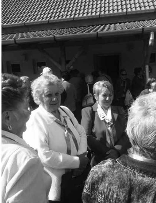
Szíves fogadtatás Vácrátóton