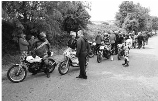
Nem öreg, de veterán motorosok hegymenetben

Júniusban Galgamácsán rendezett megbízhatósági futamot veterán autók és motorok számára a Főti Motorbarátok Köre. A III. Kurucz György Megbízhatósági GULF Futam ezúttal is számos érdeklődőt vonzott a községbe, illetve a veszélyeshulladék-lerakó felé vezető hegyi útra, ahol a régi járművek minden erejükkel összeszedve igyekeztek felkaptatni a verseny során.