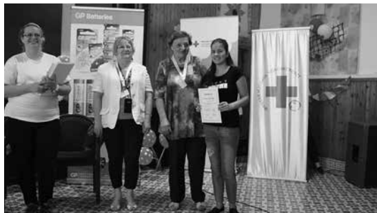
Díjátadás a legjobbaknak