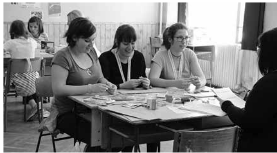
Nemcsak a gyakorlat számított, elméleti kérdésekre is tudni kellett a választ