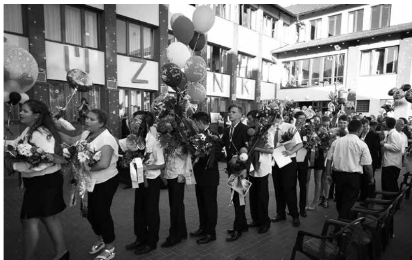
Ballagás idén a Fabriczius József Általános Iskolában, Veresegyházon