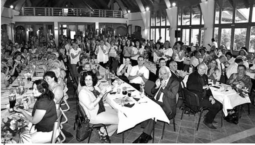
És akik az oktatás másik térfelén küzdenek-pedagógusnap a Mézesvölgyi Általános Iskolában