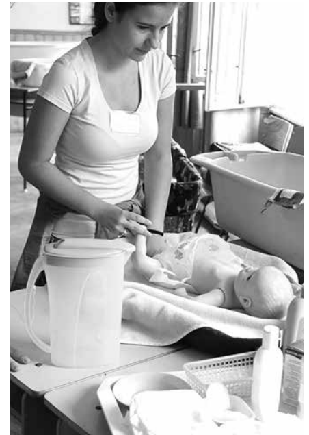
Nem babázás, szakszerű csecsemőgondozás, amit látunk