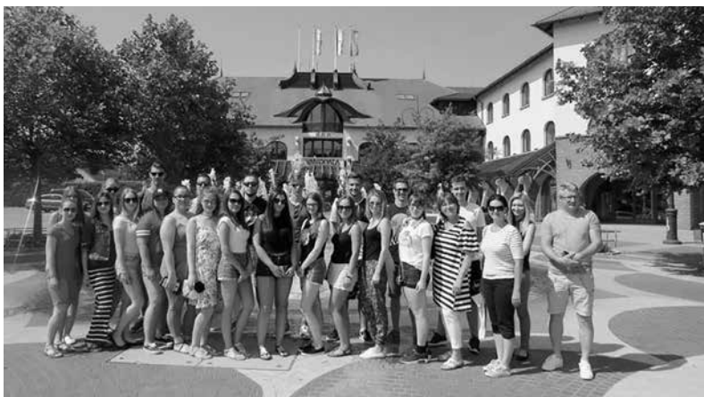
Az ipolysági diákok és kísérők a Városháza előtt, Veresegyházon