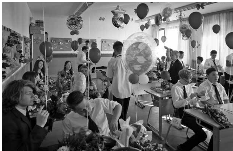
Utoljára együtt az osztály - nyolcadikosok búcsúzása

A tanárnő nagyon jó „kifutópálya” volt, ahogy azt Szabó Magda fogalmazta meg édesanyjával kapcsolatban.