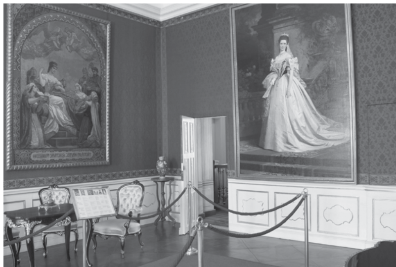
Mintha ma is ott élnének...

A királyné a megkoronázása utáni első időszakban igyekezett megfelelni az udvar elvárásainak, részt vett a protokoll eseményeken, ám ez borzasztóan megviselte. Később megpróbált kibújni e terhek alól és ez egyre jobban sikerült is neki. Leggyakrabban betegségére hivatkozott. Bécsben nehezen fogadták el, hogy nem látják az uralkodó feleségét, mert vagy Gödöllőn van, vagy Korfun tölti az idejét, vagy Madeirán pihen. Magatartásáról csúnya kritikákat közöltek a bécsi lapok, hogy különc volt enyhe kifejezés. A család megértette, elfogadta, udvarhölgyei aggódva leveleztek arról, hogy öfelsége hogy érzi magát lelkileg, milyen a fizikai állapota.