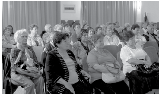
Anyukák és nagymamák a nézőtérén