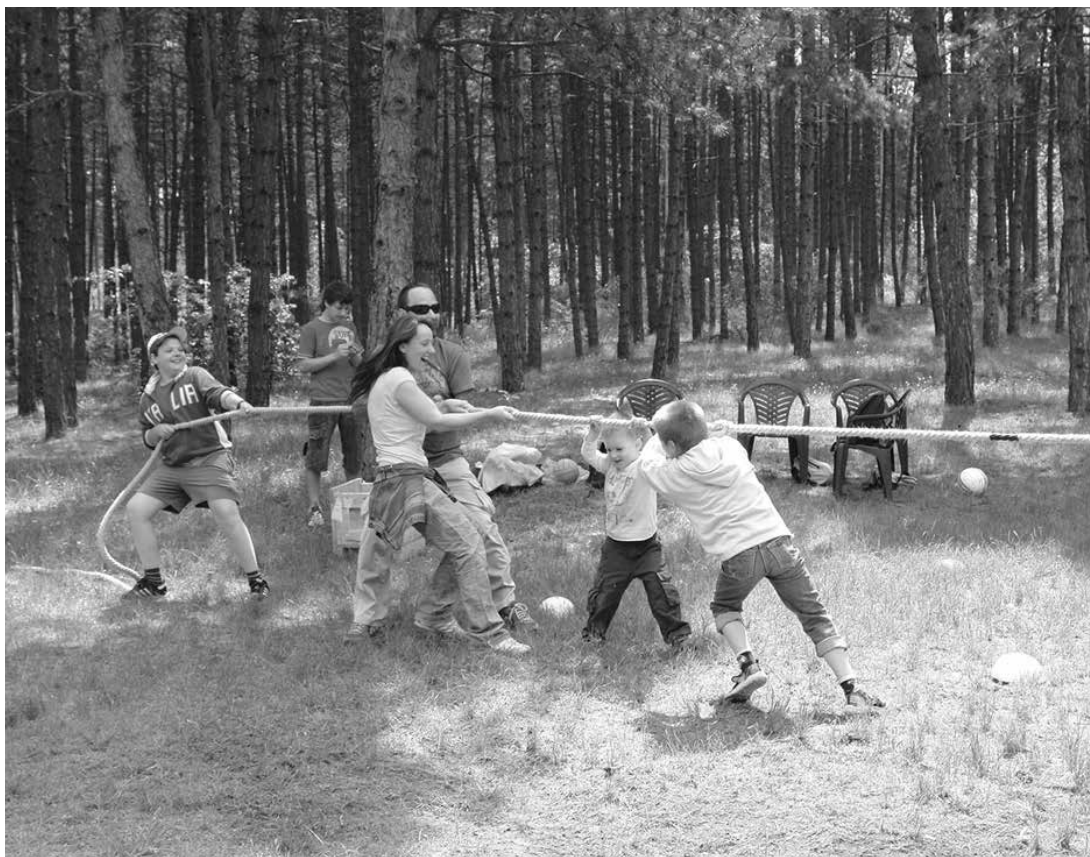
Fontos, hogy jusson idő a családra is - akár egy közös sportprogram erejéig