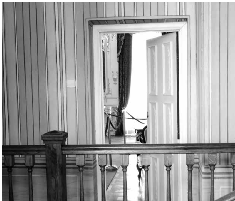
Titkok nyílnak meg a kastélyban

Hogy miként éltek, arról alig maradt fenn történelmi forrás, mert a Grassalkovich levéltár leégett. Azt tudjuk, hogy hol volt a férfi lakosztály, ennek volt része az arannyal, márvánnyal díszített Mária Terézia szoba. Akkoriban szokás volt, hogy a főurak kialakítottak egy reprezentatív helyiséget, arra az esetre, ha a király pár meglátogatná őket. A kastély ura 1751-es látogatásakor a saját lakrészt engedte át a királynőnek. Az északi szárnyban helyezték el a hölgyeket, de Ferenc József idején megcserélték a lakosztályokat, amikor átalakításokat végeztek a kastélyban az uralkodó kívánsága szerint.