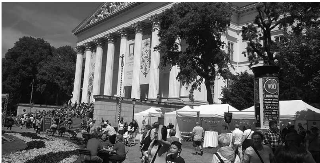
Benépesült a Múzeumkert

Koncertek, gyermekprogramok, irodalmi műsorok színesítették a tudás-kavalkádot. A zeneszínpadon nagy sikerrel szerepelt többek között a Nemadomfel Zenekar és a Villon trió.