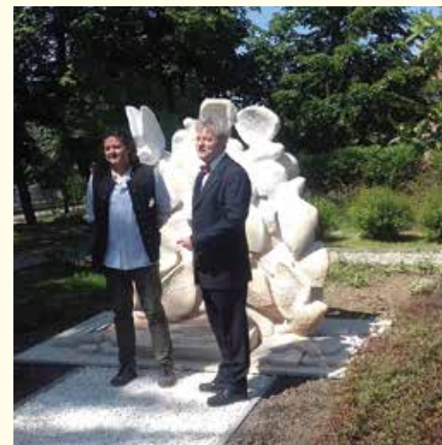
A szobor alkotója és a település polgármestere együtt leplezték le az emlékművet.

A szoboravatáson beszédet mondott Vécsey László, a körzet parlamenti képviselője, és megjelent több kistérségi illetve környező település polgármestere is.