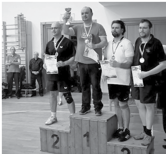
A férfi hobbijátékosok legjobbjai