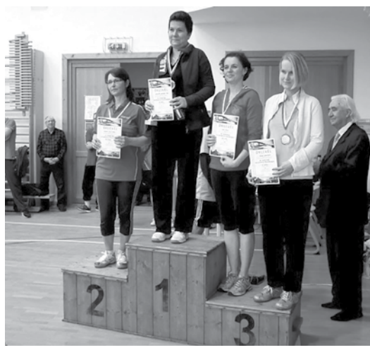
Felnőtt Női egyéni dobogósok