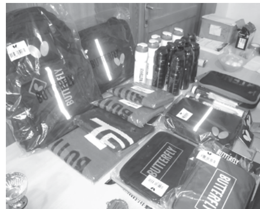
Értékes díjak vártak a győztesekre