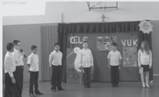
A névadó, Fekete István munkásságát idézték fel az iskolások

Ezen a napon minden az intézmény névadójáról és műveiről szolt: az alsósok számára mesemondó verseny, a felsősöknek Ki tud többet Fekete Istvánról kvíz , rendhagyó tanórák, és az író életútjáról szóló megemlékezés töltötték ki a tanítási napot.