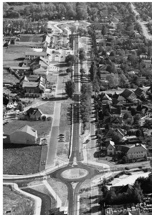
Ezt a képet is bemutatták a januári, Épül-szépül Veresegyház címmel megrendezett fotókiállításon, amely a városi létről, a változások megéléséről szóló riportunk ötletét adta.

- Történt egyszer, hogy a faterom nyakon vágta az állatot, megszurta, majd bement a házba, lehúzott egy jó felest. Mikor kijött, a disznónak csak hült helyét találta. A kert végében, a kerítésnél mászkált, ott adta ki a lelkét. Malacot az ősök a veresi