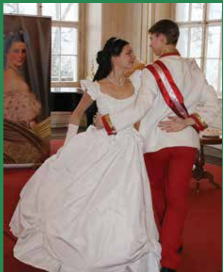
Kis izelítő az Erzsébet bál hangulatából