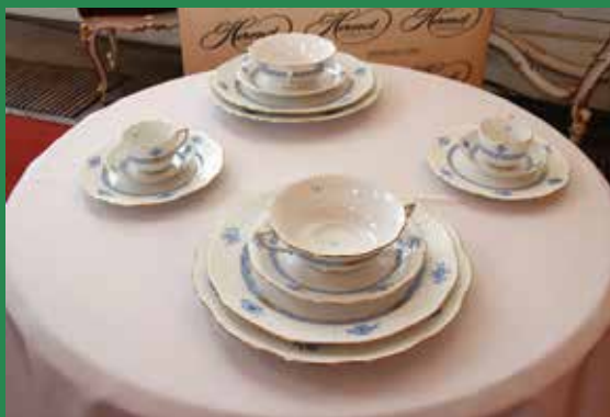
Az Apponyi-mintás étkezés, amivel a bálon terítékek majd