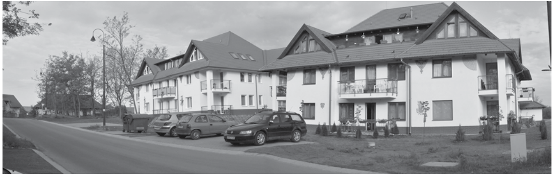
Az egyik legújabb városrész, a Ligetek most is folyamatosan tovább épül