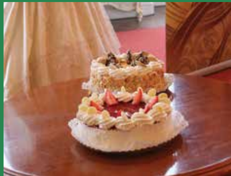
Erzsébet torta, epres, kókuszos, habos finomság