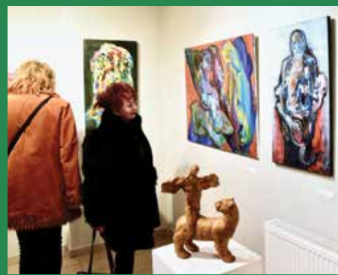
Mágikus képekben és szobrokban gyönyörködtünk