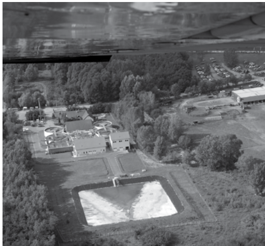
Az emelkedő lélekszám olyan beruházásokat is szükségessé tett, mint a szennyvíztisztító bővítése és korszerűsítése, 2013-ban. Ez a kép is szerepelt a kiállításon. (Lethenyei)

Szombatoként a piacon találkoztunk, a Maglódiné féle büfében bevertünk egy-két felest egy pofa sörrel, elrágcsáltunk egy lángost, és szidtuk a rendszert. Jártukban-keltükben köszöntek egymásnak az emberek az utcán. Azt reméltem, itt olcsóbban tudok majd élni, mint Pesten, hát ez