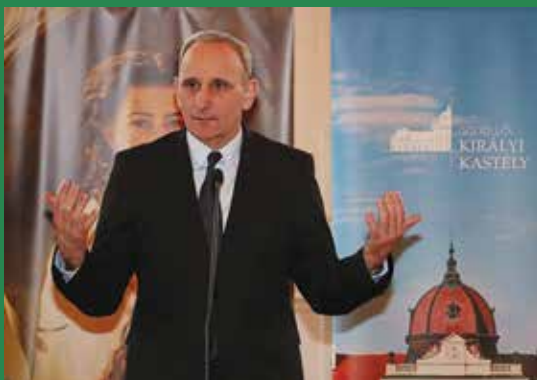
Gémesi György a tematikus évről