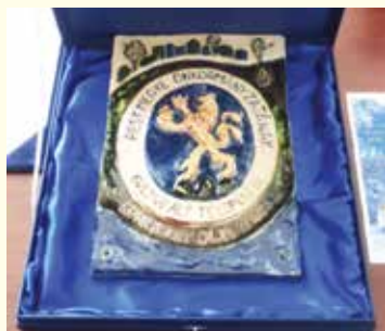
Pest Megye Kulturált Települési Környezet Díja