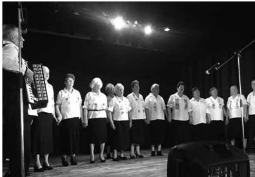
Énekes színpadi produkció