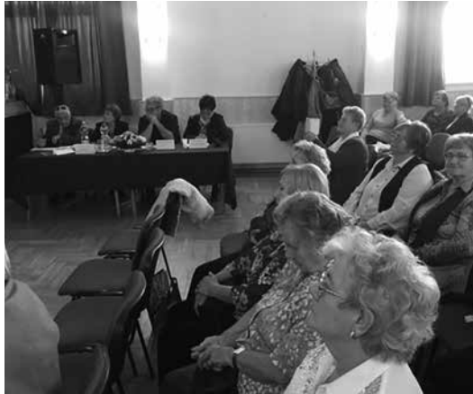
A közönség és a zsűri