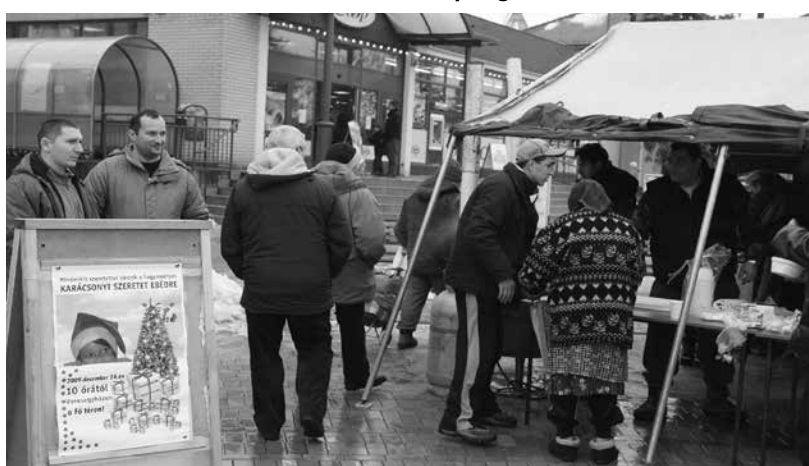
Karácsonyi szeretetebéd a múltból