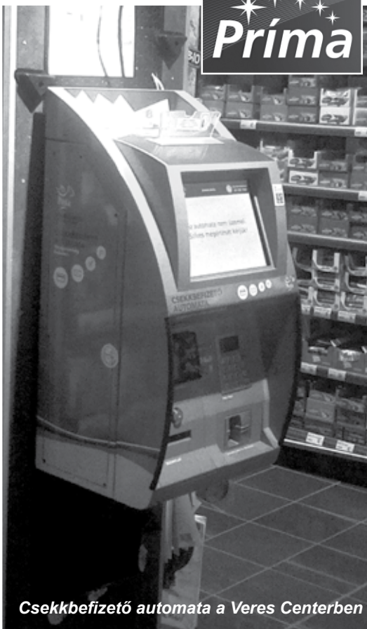
Csekkbefizető automata a Veres Centerben

Igen, valóban nem mindenki született konyhatündérnek, vagy lehet, hogy a sok munka mellett ideje, kedve nem marad a sütésfőzésre... Nem kell viszont lemondania hagyományos, szerencsehozó ünnepi ételekről, amelyeket a CBA boltokban működő grillbárokban megrendelhet az ünnepekre. Aki akár halászlét, akár sültet vagy töltött ká-