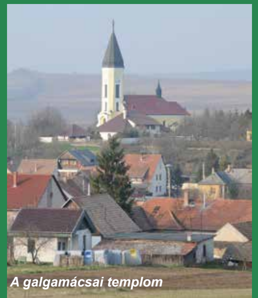
A galgamácsai templom