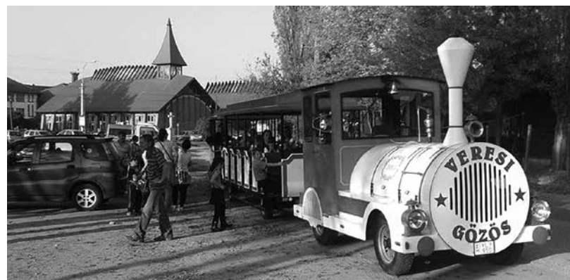
Családi nap anno, az ÉVÖGY szervezésében