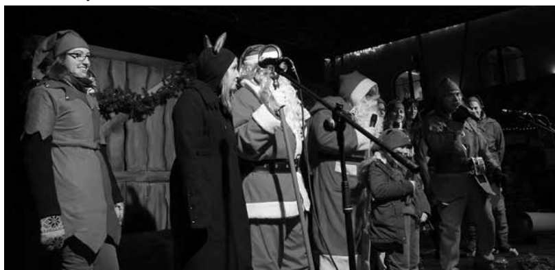
Az elmaradhatlan ÉVÖGY Mikulás ünnepség