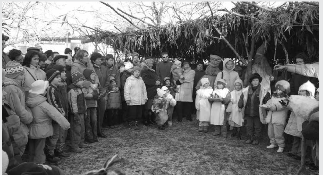
Emlék egy régebbi eseményről, gyerekek betlehemes játéka

A kiállítás a másfél évtized legjobb fotóit mutatja be az érdeklődőknek a Fő úton található, felújított Tájházban.