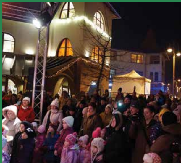
Rengeteg érdeklődő várta a nagyszakállút

A város ikonikus kisvonata egész este körbejárt a központban utasokkal megrakodva, a legfontosabb résztvevők, a gyerekek pedig szemlátomást remekül szórakoztak.