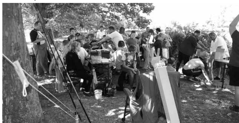
Sok éve népszerűek a nyári horgásztáborok