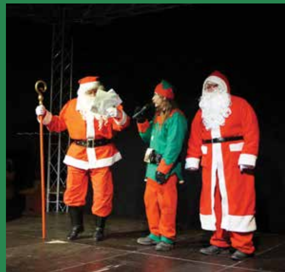
Mikulás ünnepség a veresegyházi főtéren, az ÉVÖGY szervezésében