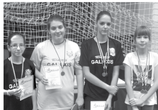
A felsős dobogós lányok