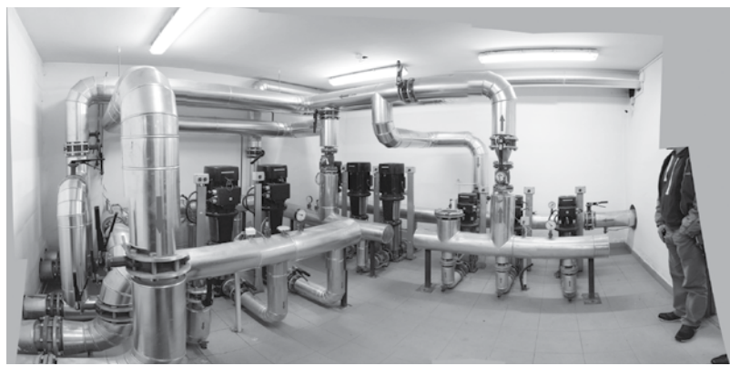
A városi intézmények fűtését évek óta a környezetbarát geotermikus energia biztosítja

Van, aki fával fűt, mások gázzal és gyakori a két-kombinációja is, amikor felváltva használják a gáz, illetve a szilárd tüzelésű kazánokat, így takarékoskodva a gázzal. Az olajtüzelés csaknem kiszorult a háztartásokból, az elektromos fűtés pedig még nem honosodott meg hazánkban. Divatja van a cserépkályháknak és a kandallóknak. Ezek a berendezések egyre inkább „tevéőlegesen” vesznek részt az épület fűtésében, túl azon, hogy hangulatosak.