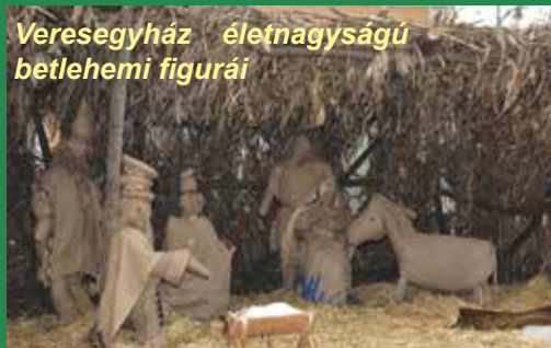
Veresegyház életnagyságú betlehemi figurái