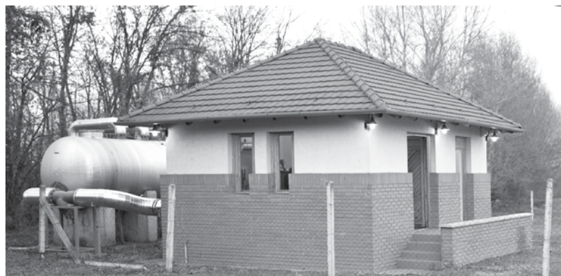
Az egyik veresegyházi termálkút

Itt a fűtési szezon, és sajnos, évről évre olvashatunk a nem megfelelően működő készülékek okozta tragédiákról. Függetlenül attól, hogy hiszünk-e a kémény telet ígérő előrejelzéseknek, fontos átgondoltan, és a számunkra elérhető legjobb módon működtetni a családi tűzhely melegét. Térségünkben zömében családi házban élnek az emberek, ami nagy szabadságot ad a megfelelő fűtési rendszer kialakításában. A hagyományos, közkedvelt fűtési módok mellett azonban nem árt, ha tudjuk, hogy rendelkezésünkre állnak már olyan modern, környezetbarát lehetőségek is, amelyek hosszú távon rendkívül gazdaságosak. Ősz végi körképünkben azt vizsgáljuk, mivel és hogyan fűtünk az idén!