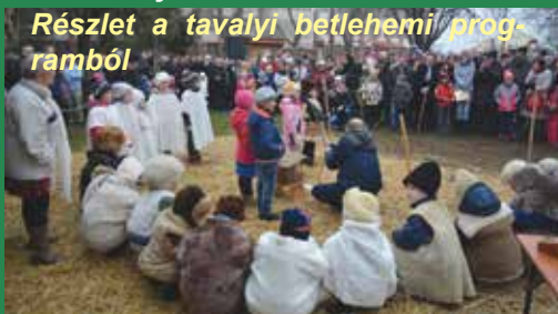
Részlet a tavalyi betlehemi programból

17. 30 SokKos zenekar karácsonyi koncertje A rendezvény szervezői: Agora Kör, a Hagyományörző Népi Együttes és a Váci Mihály Művelődési Ház