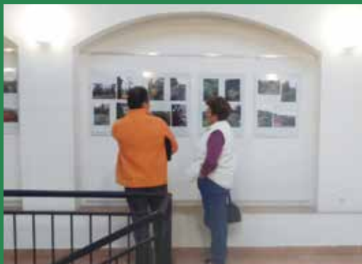
Kiállítás a díjazott kertek fotóiból