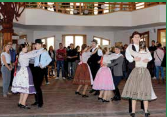
Az iskolák programokkal is bemutatkoztak