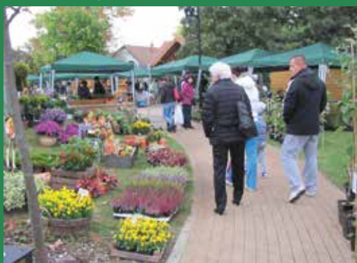
Bemutató és növényvásár a községi parkban