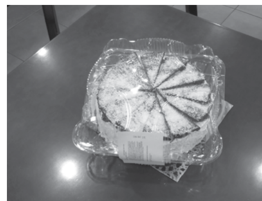
12 szeletes, helyben készült torta 1790 forintért