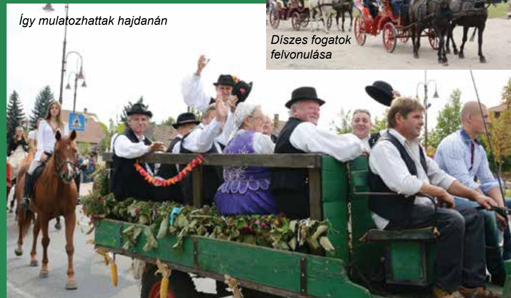
Így mulatozhattak hajdanán