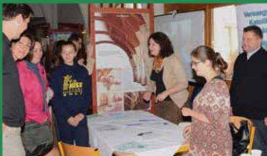
Jövőre már a katolikus gimnáziumba is lehet jelentkezni