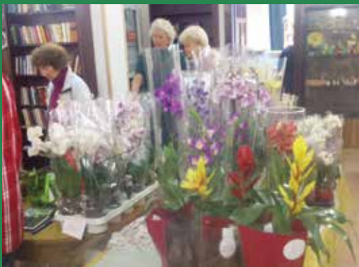
Orchideavásár a Faluházban

Erdőkertes, a Kistérség második legnagyobb települése ezúttal a saját nevéből indult ki, azt izelgették a Kertészek Erdőkertesért munkacsoport szervezői, megállapítva, hogy a kellemes hangzás