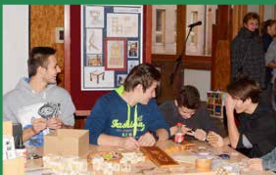
Ősszel bemutatkoztak a középfokú tanintézmények

Remélhetőleg sok általános iskolás kapott kedvet valamilyen iskolához, szakmához, és a bizonytalankodók vagy tanácsaltanok számára is könnyebb lesz a döntés a személyes találkozás után, melyet hamarosan az intézményi „háztűznézők”, a nyílt napok követnek.