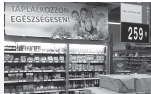
Diétás, laktózmentes, gluténmentes élelmiszerek bőséges választéka