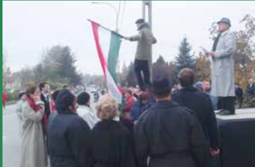
A diáktüntetés és a forradalom kibontakozásának meglevenedett pillanatai

fogni és harcolni egy cél érdekében. A közös cél ma a fejlődés, amihez szintén szükség van a szellemi közösségre.