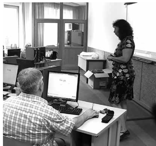
Igy zajlottak a foglalkozások

Akit érdekel az internet világa, az arról szóló előadás, tanfolyam vagy klub, kérjük, jelentkezzen a veresegyházi Kölcsey Könyvtárban, ahol mindenki jelentkezését fogadják, és a továbbiakról folyamatosan értesítést kaphatnak.