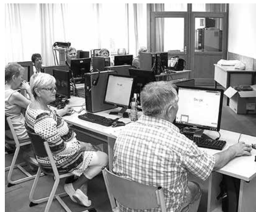
Szeniorok az iskolapadban

Az idős korban megőrzött aktivitás, a szellemi frissesség megőrzésére tett erőfeszítések, és a közösségi életben való aktív részvétel is kiemeli az átlagból azokat a kedves hölgyeket és urakat, akik eljöttek a tanfolyamra, és akik a további órákra ill. a tervezett internetes klubra el szeretnék majd jönni.