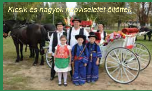
Kicsik és nagyok népviseletet öltöttek

Veresegyházon idén szeptember 25-én volt a szüret, melyre a szívesen emlékszünk vissza néhány szép fotóval.