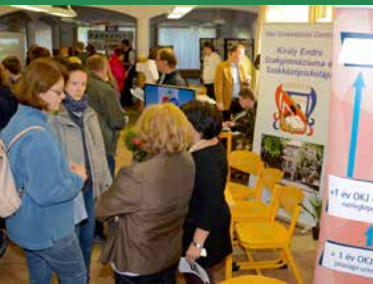
Hagyományosan nagy az érdeklődés a szak- középiskolák iránt