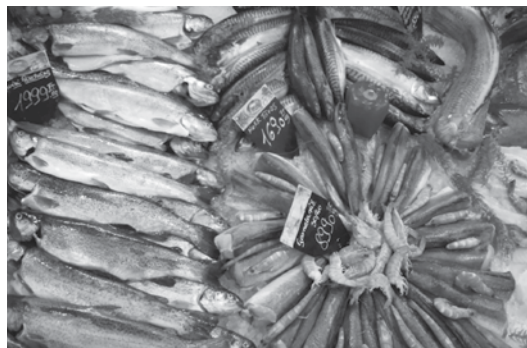
Gazdag kínálat a halaspultban

hozzávalók szerint változnak, de a sütemény mindig friss, hiszen helyben készül. Lehet tehát ráhangolódni az ünnepekre, úgy, hogy közben csupa egészséges élelmiszer kerül a kosarakba, és még pénzt is takarítunk meg!