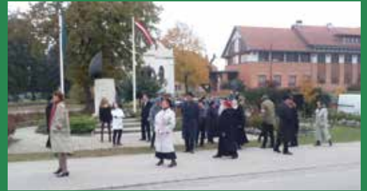
Ünnepi műsor, korhű öltözékben, a város művészeti csoportjainak összefogásában

Ünnepi beszéde után a város kulturális csoportjainak közös előadásában a forradalom kirobbanásának napját idézte fel az Októberi tavasz című látványos produkció.