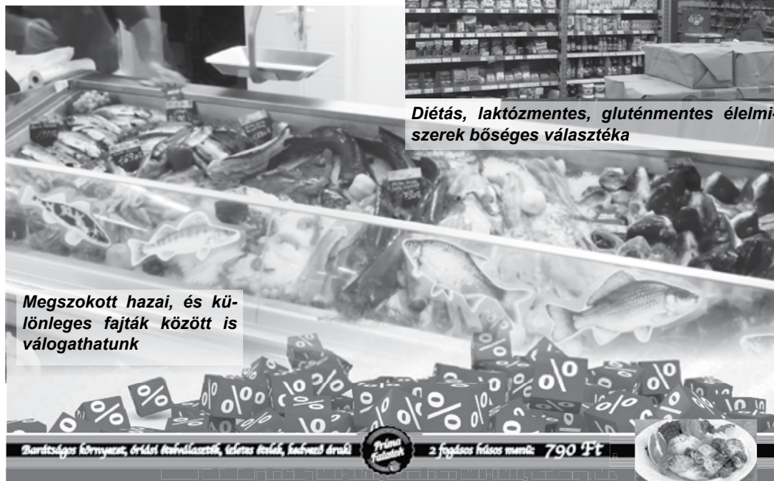
Megszokott hazai, és különleges fajták között is válogathatunk