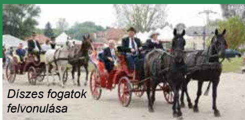
Díszes fogatok felvonulása