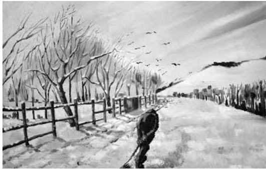
SZENT ISTVÁN NAPJÁN