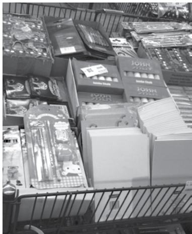
Füzetek, írószerek várják leendő gazdáikat a Szada Centerben

A nagyobb mennyiségben vásárlókat továbbra is várja a veresi CBA Bevásárlóház és a kertesi CBA Cent, ahol még mindig zajlik a kartonnal olcsóbb akció!