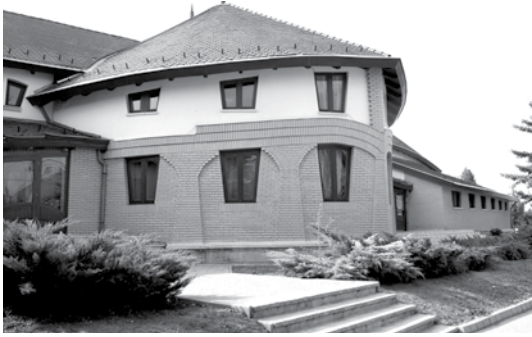
Megújul a Széchenyi téri óvoda is

Megkötötték a megállapodás a gimnáziumot illetően a katolikus egyház és a város között. Tervek hiányában a becsült költség 300-500 millió forint, a költségeket fele-fele arányban viselik a partnerek. 2017 szeptemberében kezdődhet el az oktatás – egyelőre két osztályban - a város első, nappali tagozatos középiskolájában. Ez az együtt-