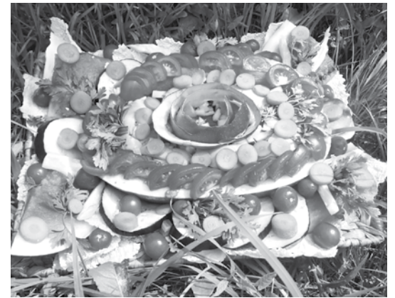
Szülinapi torta Barátkozó módra