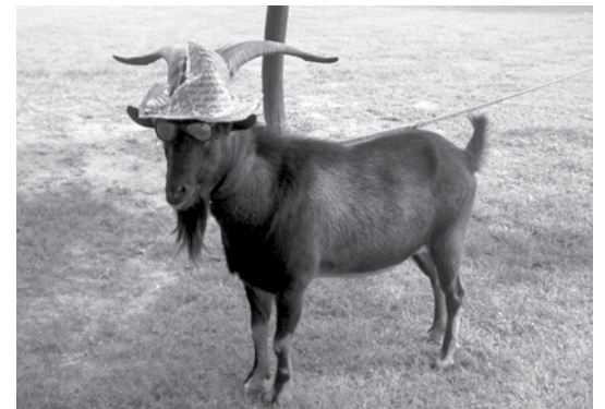
Fel a kalappal!-gondolta a kecske a pillanat hevében

A Kistérség A Veresegyházi Többszörös Kistérségi Társulás Lapja