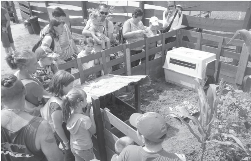
Megjötték a vendégek, indulhat a születésnap zsúr