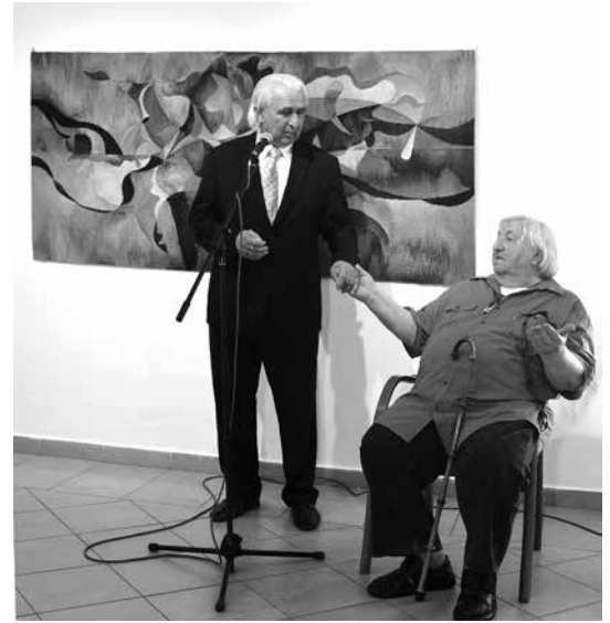
Kéz a kézben, így tudnak ők együtt gondolkodni, hogy Veresegyház még szebb, egyedibb legyen (Lethenyei)