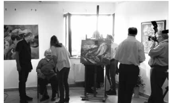
Ahogy mindig is látjuk, szerényen, kedvesen a gratulálók között