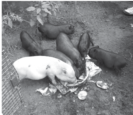
A kicsinyek persze malackodtak a tortával

- Az első születésnapunkat családiasan ünnepeltük meg, zöldségekből készült tortával köszöntöttük fel az állatainkat, és kicsit bolondoztunk velük, de október 9-én, amikor az Állatok Világnapját ünnepeljük meg, már mindenkit várunk rendezvényeinkre! Az ősz folyamán újabb előadássorozatot tervezünk, „Társállatok” címmel, olyan állatokról, amelyek ugyan a környezetünkben, de rejtőzködve élnek, mint például a róka és a nyest. Ezekre várjuk az iskolásokat, akiket hamarosan igazi kalandpark is szórakoztat majd a területünkön. -