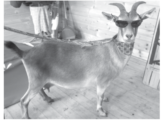
Öltözködési versengés alakult ki a partira

Az Élmenyporta és Barátkozó lámája sem marad sokáig egyedül: hamarosan egy hím érkezik hozzá, így remélhetőleg ő is családot alapíthat, és az intézmény újabb kedvencel gyarapodhat. Hiszen a fő cél, hogy itt mindenki, állat és ember, fiatal és idős jól érezze magát együtt.