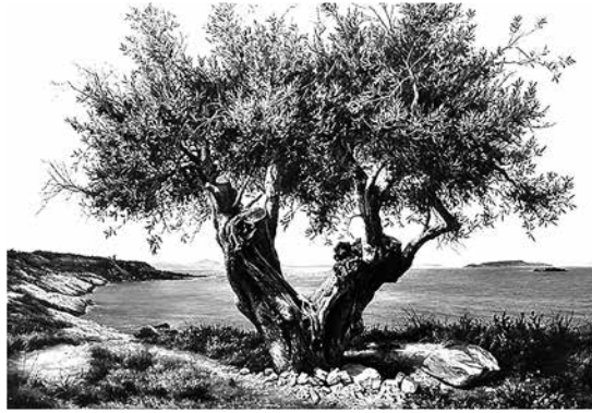
Az egyik legismertebb bibliai növény, az olajfa

A részvétel szintén ingyenes, de regisztrálni kell!