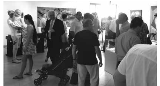
Barátok, tisztelők, tanítványok a kiállítás megnyitóján