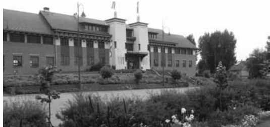
Vereseygházi Kálvin Téri Református Általános iskola