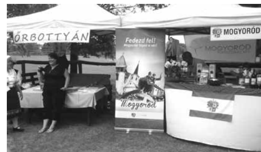
Órbottyán és Mogyoród település bemutatkozó standjai