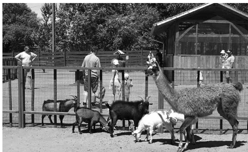
Az állatsimogató kedvencei