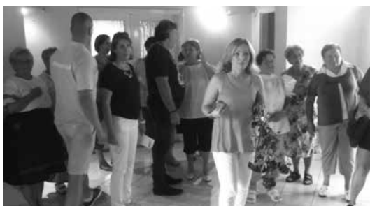
Fellépés előtt, még civilben a Z'zi Labor és az Asszonykórus