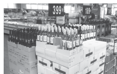
Akcióban a szurkoláshoz is fontos borok

Tudva, hogy a mi a fontos a szurkoláshoz, és mennyire kevés idejük van az embereknek sokszor, hogy felkészüljenek az esti meccsnézésre, a térségi boltok mindegyikében kialakítottak egy kis EB-szigetet, ahonnan a focinézés legfontosabb kellékei pillanatok alatt a kosárba kerülhetnek. Természetesen minden, ami itt található, lényegesen kedvezőbb áron vásárolható meg ebben az időszakban. Nemcsak kellemes bor, chipsek, sörök, rágcslánivalók állnak a focirajongók rendelkezésére, hanem futball labdák is, és egyéb kellékek, amik igazi élménnyé teheti a szurkolást.