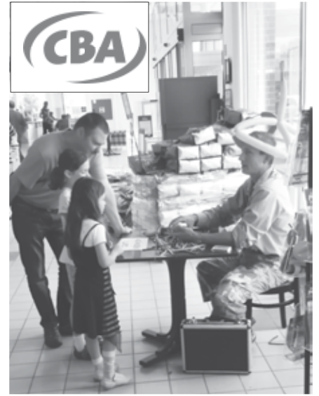
Évfordulós meglepetés a Szada Center vásárlóinak

A fűszerezett húsok mellett természetesen különféle ízesítésű grillkolbászok és grillezni való sajtok is kaphatók. Ahogy befelé haladunk a nyárba, egyre több zöldség és gyümölcs kelteti magát a polcokon, és az árak is egyre csökkennek. Június végén igaz, még Görögországból érkezik a görögdinnye, de már nagyon kedvező áron kínálják, és lényegében napról napra olcsóbb lesz. Ha nyár, akkor természetesen fagy, minden mennyiségben! Az üzletekben jégkrémek, a grillbárokban rendes, gombócós fagy formájában... A grillekben a fagy szintén akciós áron kapható, így a bevásárlás összeköthető akár egy kellemes családi fagyizással is, és a gyerekek is jobban rávehetőek így az együttműködésre.