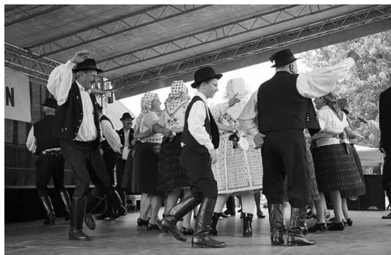
A veresi hagyományörzők fergeteges tánca