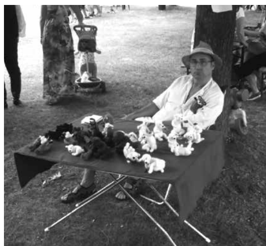
Kézművesek, árusok ösvénye

Az első Mézes Mackó Fesztivál sikerrel debütált, hiszen jól érezték magukat a látogatók, remek kedvvel vettek benne részt a közreműködők, bár természetesen a kezdet nehézségei nem kerültek el. Annyi bizonyos, hogy a második még jobban sikeredik majd. Viszlát jövő ilyenkor, mindenki jegyezze fel a naptárába, hogy a vakáció első hétvégéjét ne feledje a Medveotthonban tölteni majd!