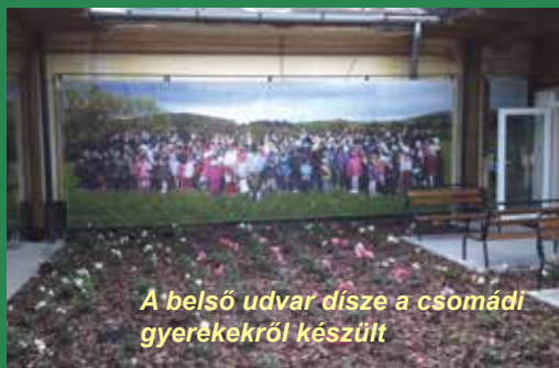
A belső udvar díszje a csomádi gyerekekről készült

Klement János polgármester avató beszédében hangsúlyozta, hogy milyen örömmel és büszkeséggel adja át az egészségházat, ami már valóban minden igényt kielégít. A földszintjén 2 felnőtt háziorvosi és egy gyermekorvosi rendelő, védőnői helyiség és kiszolgáló egységei kaptak helyet, egy fiókgyógyszertárral, és átmenetileg a községi postahivatallal kiegészülve. A tetőtérben két nagyobb méretű szolgálati lakást alakítottak ki, ám hamarosan a polgármesteri hivatal helyezi át oda ideiglenes működését. Hogy miért? Nos, mert az egészségköz-