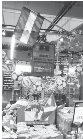
Egy csokorban minden, ami a meccsnézéshez kell, és az árak is sikerre számíthatnak

A futball körül forog ugyan a világ ebben a hónapban, de azt is észre kell vennünk, hogy ha rapszodikusán is, de megérkezett az igazi meleg nyár! Bármikor összehozhatunk egy kerti partit, főzhetünk, süthetünk a szabadban, hiszen az sokkal hangulatosabb mindenkinek. A CBA boltokban jelentős árkedvezményrel vehetünk még szinte bármilyen szezonális terméket: a grillezéshez kiváló tarjafile kilója csak 1199 Ft, a pácolt tarja és csirkemell 1899 Ft/kg, a Kentucky ízesítésű csirkeshártya pedig alig 899 Ft/kg.