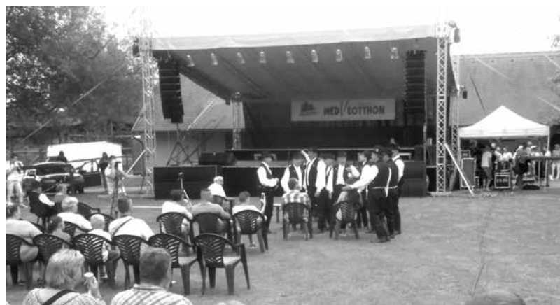
A Veresegyházi Hagyományörző Népi Együttes tagjai duhajkodnak