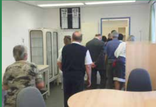
Éles szemmel megvizsgáltuk a jól felszerelt rendelőkét is