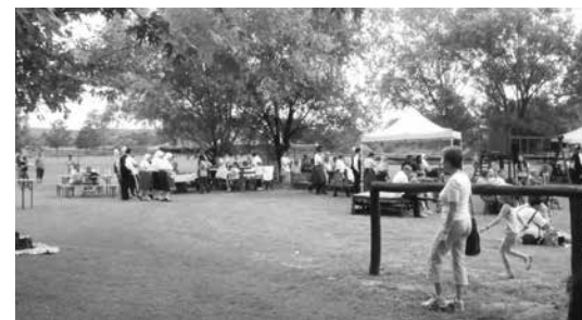
Családi piknik pillanatok az Élményportán