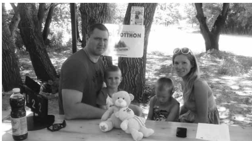
Egy kedves, távolról érkezett család a rekordkísérletre szánt mackókkal