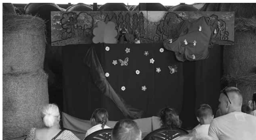
A Bála Színház előadása kicsiknek