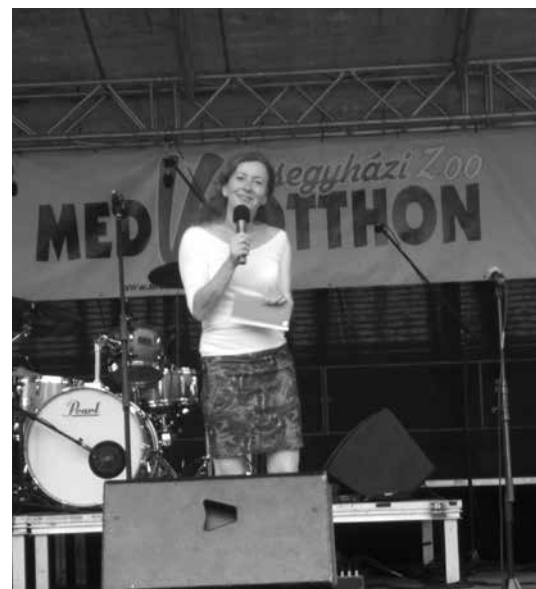
A Kistérség Újság díjat ajánlott fel születésnapja alkalmából

A szombati nap inkább a rekordkísérletről és a családi programokról szólt, a vasárnap azonban