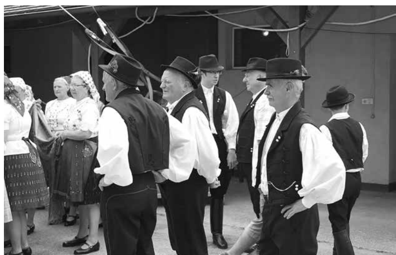
A Hagyományörző Népi Együttes bevetés előtt