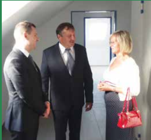
Az épület bejárása közben Tuzson Bence országgyűlési képviselő, Klement János polgármester, és Sipos Zsuzsa kistérségi referens

Az átadás helyszínére igyekezve leginkább az tűnt fel, hogy mennyire nem hiányzik a régi, szinte már romos épület, ahol korábban az orvosi rendelők kaptak helyet, és milyen jól illik már az új, szemre is modern intézmény a község