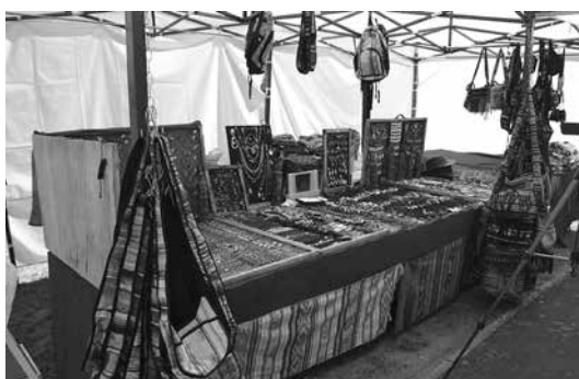
Szépséges kézműves termékek vására az Élményportán