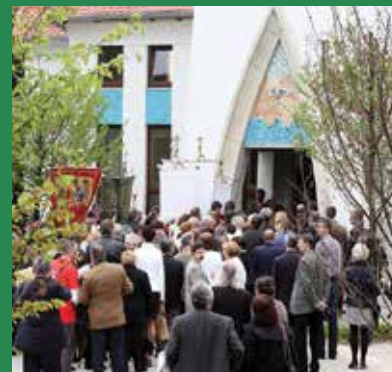
A vendégek bevonultak a templomba, és megkezdődött a felszentelő mise.