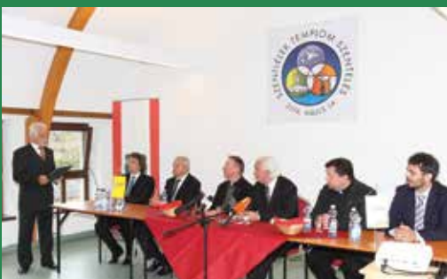
Sajtótájékoztató zajlott az egyházmegye, a város, a tervező és a kivitelezők képviselőinek részvételével.