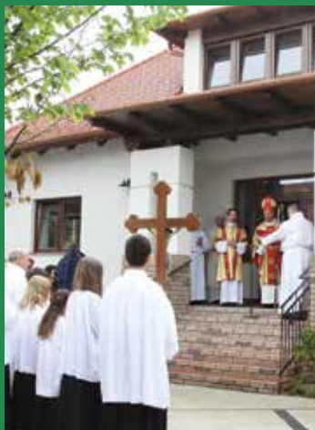
Az ünnepség az új plébánia felszentelésével kezdődött