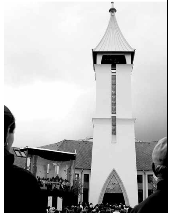
Életre kelt a Szentlélek templom