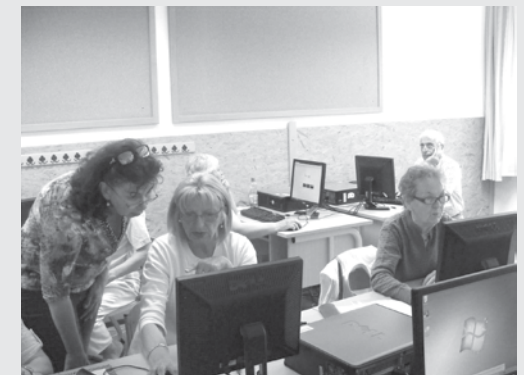
Idősebbek is elkezdhetik, szakértő segítség- gel