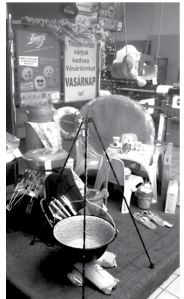
Nyári szezonális termékek akcióban

A szuper akciók sora megkezdődik már a hónap utolsó hetében, hiszen május 26-június 1. között számos terméket kínálnak rendkívül kedvező árakon. Több hústermék mellett olcsóbb lesz a friss sertésoldalas, kilogrammonként 749 Ft-os áron, és mindössze 750 Ft/kg a cba-s sertésvirslí ára ebben az időszakban. A pékség termékei között is találunk akciót, és a zöldségek közül akciós lesz a kigyóuborka, 299 Ft/kg áron. A nyárelő a kerti sütögetés szezonja, erre tekintettel a faszén 799 Ft helyett 599 Ft-ba kerül, a finom Piroska szörpöt pedig 579 Ft/üveg helyett 399 Ft-ért vehetik meg a vásárlók. A felsoroltakon túl több tisztítószer, italféleség, sajt és kávé kapható akciós áron, érdemes lesz többször is ellátogatni a hamarosan 9 éves boltba!