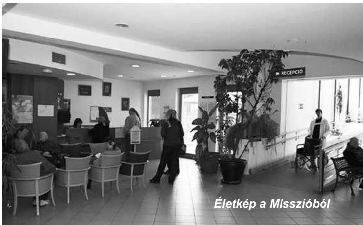
Életkép a Misszióból

Nemcsak ez volt az egyetlen változás 2009-ben... Jogilag megszűntek a kht-k is, és át kellett alakulnunk non-profit kft.-vé. Ekkorra elvesztettük a nappali kórház finanszírozását, és megszűnt ugye az irányított betegellátási modell is, így új célokat kellett meghatározni a Misszió számára, hiszen csupán a járóbeteg-ellátásból nem lehetett volna a működést finanszírozni. Amikor pályázatot írtak ki egynapos sebészeti ellátás bevezetésére, sikerrel pályáztunk, és így már sikerült megtartanunk a nappali kórházat is, ami nagyon fontos szegmense a térségi betegellátásnak. Addigra már beletanultunk a pályázatiírásba, hiszen 2007 óta kiegészítő tevékenységként szakértői megbízásokat vállaltunk EU-s pályázatokban azért, hogy ezzel is növeljük a bevételt. A pályázatok az utóbbi években megritkultak ugyan, de igyekszünk hasonló módon kiegészíteni az intézmény jövedelmét: gyakorlati lehetőséget kínálunk szakápolóknak, gyógytornászoknak, masszőröknek, és első éves orvostanhallgatók is nálunk tölthetik a kötelező