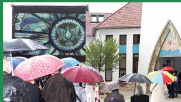
A szemerkélő eső miatt nem mindenki jött el, aki tervezte