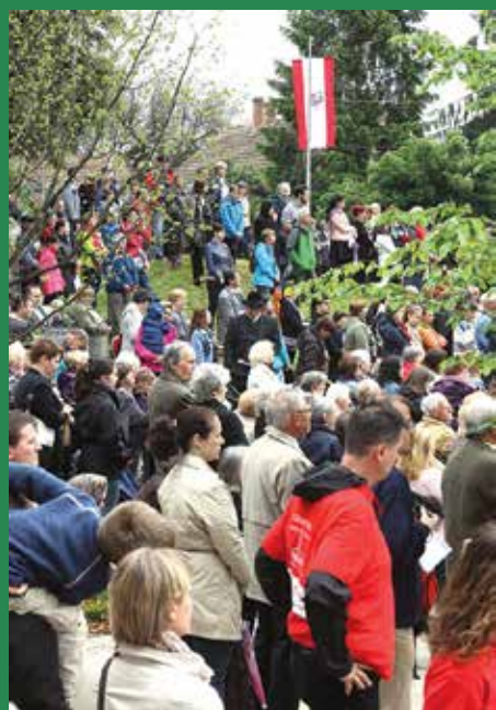
Délutánra elállt az eső, és egyre többen érkeztek a templom előtti térre