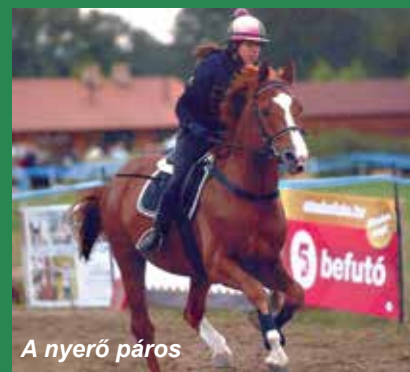
A nyerő páros