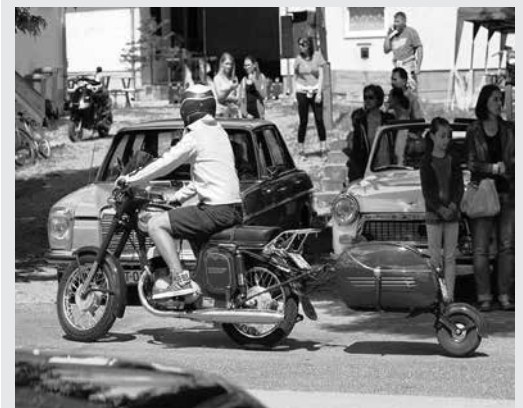
Veterán motorok versenye a tavalyi falunapon