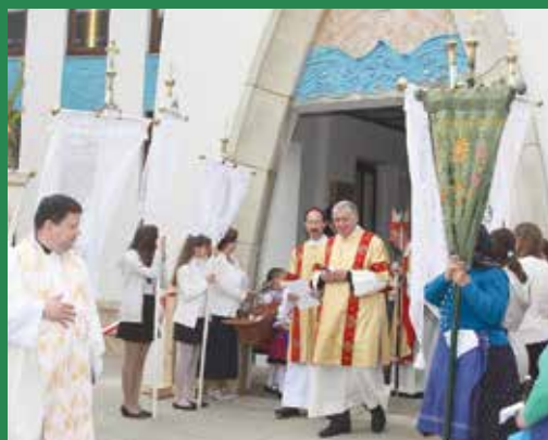
A szentmise véget ért, menjetek békével....