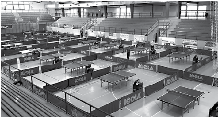
A mohácsi sportcsarnok asztalai a versenyzőkre várva

A 28 ezres lélekszámú rendező város Mohács igazán kitett magáért. A nagy városi sportcsarnokban 18 asztalon folytak a mérkőzések. A díjátadón megjelent a Busó vezér is :,) valamint népviseletbe öltözött lányok hozták párnán az érmekeket