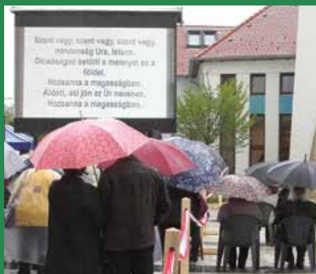
A Szentmise eseményeit kivétítőn követhették a téren várakozók.