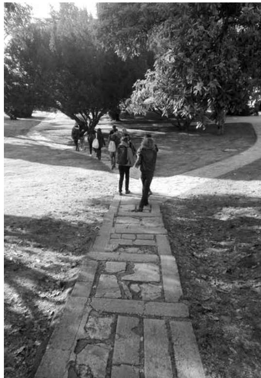
A programba a séta is belefért