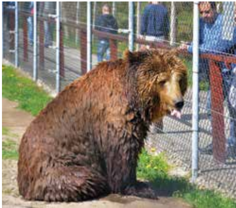
Mézes Mackó Úr