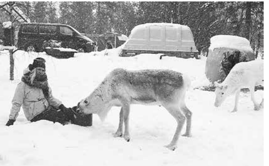
Barátkozás a rénszarvasokkal