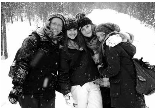
Finnországban márciusban is könnyen beavazódik az ember