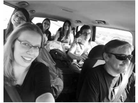
Vidáman telt az utazás is