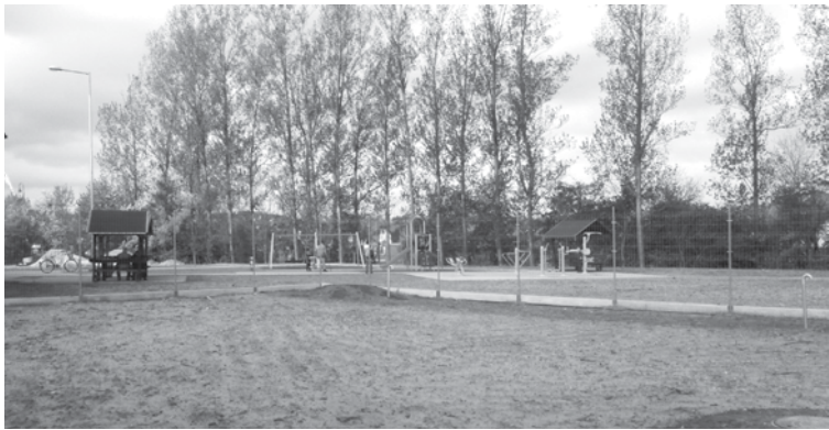
A Veres Center mögötti játszótér még alakul, de lassan már felfedezik a családok

A vásárlók gyorsan elfogadták az új élelmiszer-áruházat, ami szinte egyik napról a másikra lépett a szomszédságában álló régi Veres Center helyébe. A költözés zökkenőmentesen, és a vevők számára észrevétlenül zajlott, a régebbinél jóval tágasabb, többféle cikket felvonultató, és számos újdonságot bevezető új üzlet hamar népszerűvé vált. A puding próbája azonban természetesen az evés, és ez a mondás beigazolódott a működés első pár hónapja alatt is, hiszen a vásárlók többször szóvá tették, hogy a hatalmas térben nehezen találják meg az egyes termékeket.