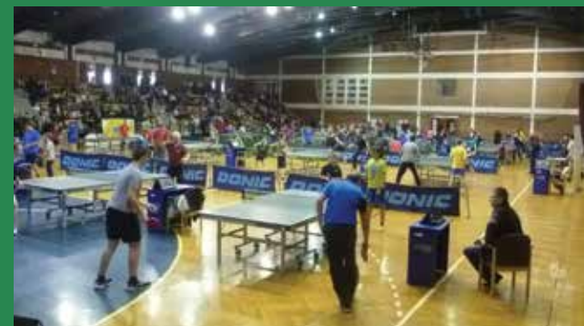
A diákolimpia meccsei