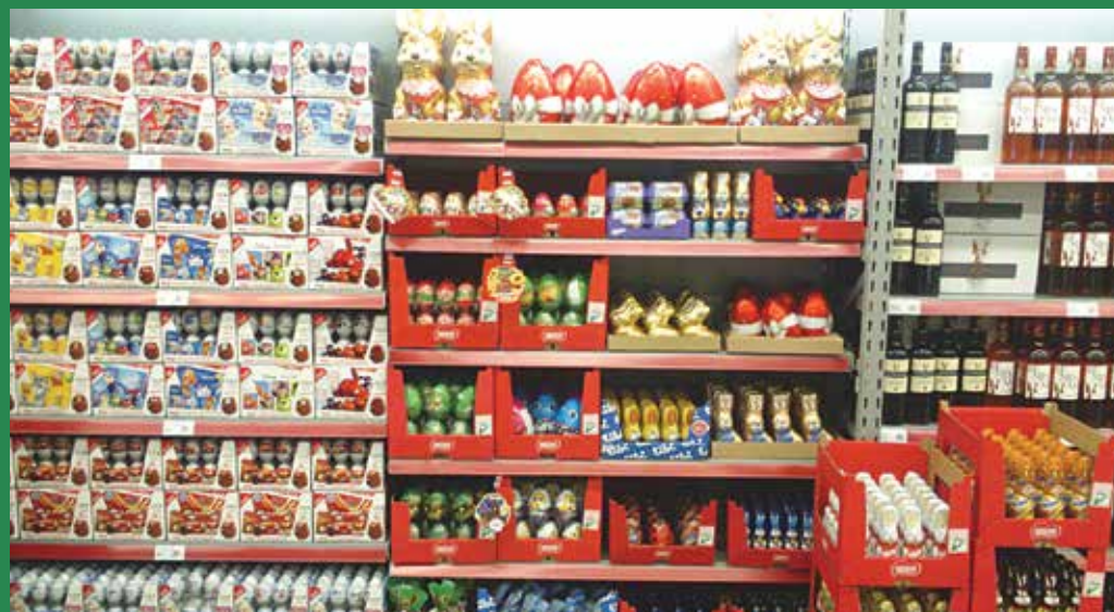
Csokitozások, csokinyuszik ékes rendben várják vevőiket