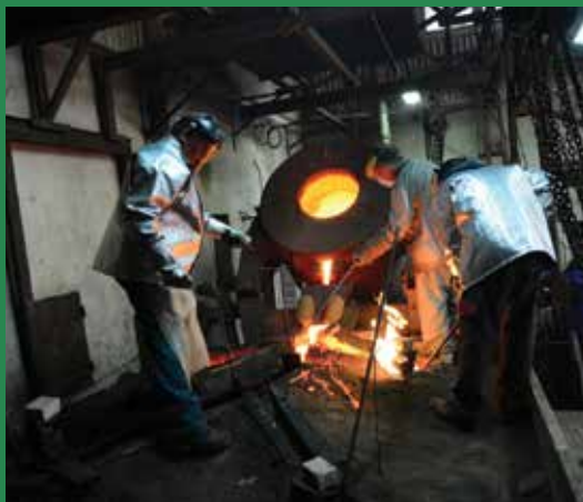
A harangöntés kényes művelete

Fordulópontjához érkezett a veresegyházi Szentlélek templom építése: februárban az őrbottyáni harangöntő műhelyben elkészültek az új templom harangjai. A harangokkal megszületett a templom lelke is, miközben az építkezés a szemünk láttára érkezik lassan a végkifejlethez. Március 4-én, délután már a toronysisak kerül majd daruval a torony tetejére, szimbolikusan lezárva az épület fizikai valóját. Ez lesz az építési folyamat leglátványosabb része, aki teheti, ne felejtse el megnézni!