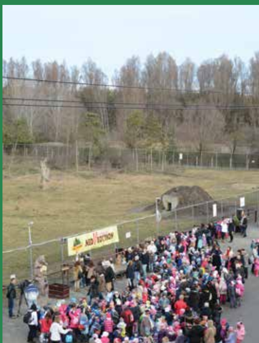
Rengeteg érdeklődő vett részt a Medveébresztőn