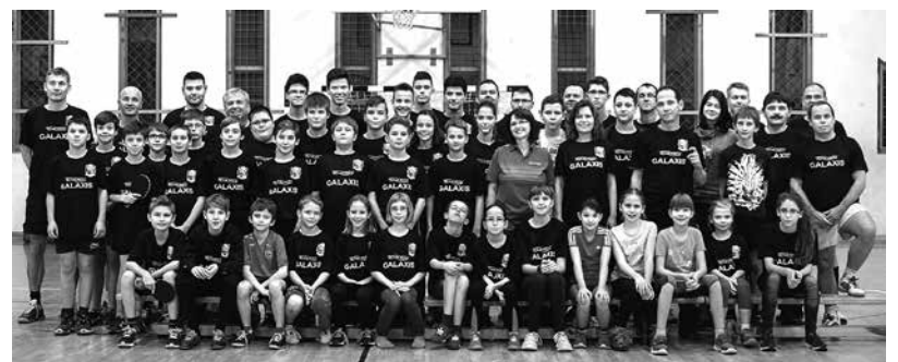
Együtt a csapat, a Galaxis Asztalitenisz Klub