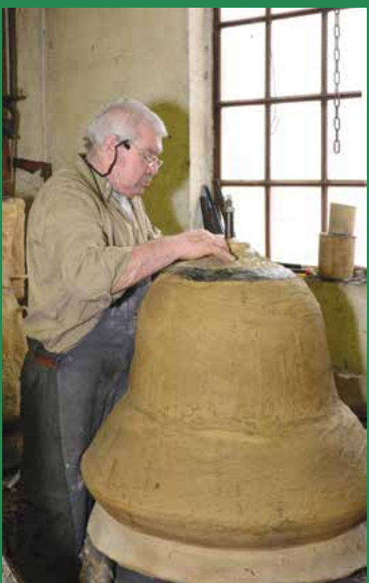
Elkészültek az új veresegyházi templom harangjai az őrbottyáni műhelyben

Egy gondolat erejéig visszatekintünk január végére, nevezetesen a Magyar Kultúra Napjára, mely alkalomból számtalan színes kulturális program zajlott kistérségünkben. Egyik kedvencünk az Erdőkertesi Faluházban megrendezett Jack London vetélkedő volt, melyet helyi irodalombarátok szerveztek. Az eredmény ezúttal nem is volt igazán lényeges, sokkal fontosabb volt, hogy egy estére meglevenedett a nagy író munkássága, felidéződtek híres regényeinek feledhetetlen mondatai. Ugye, mindannyiunknak van kedvenc Jack London regénye? Itt az idő elővenni, és elolvasni újra! ( Én a Vadon szavát nem tudom sosem megunni....)