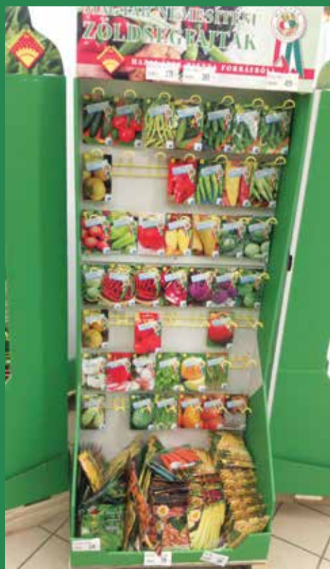
Kiskertekbe kívánczó vetőmagok