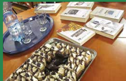
Jack London művei a terítéken