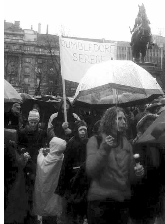
Ez a tüntetés más volt, mint a többi...