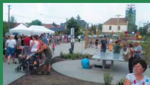
Elkészült az új játszótér, épül a templom