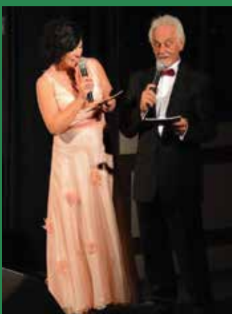
A műsorvezető páros vidám perceket szerzett a közönségnek