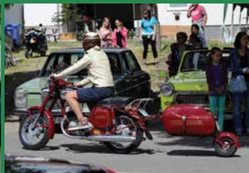
Veterán járművek versenyeztek június 21-én a galgamácsai falunapon is