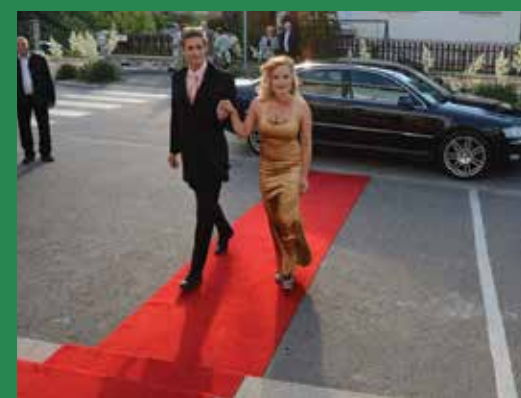
A sztárok bevonulása