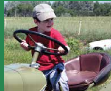
Emlékszik még rá valaki