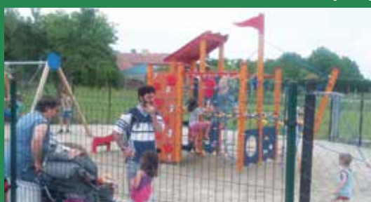
Inkább mászófal mint mászóka a kicsik sporteszköze