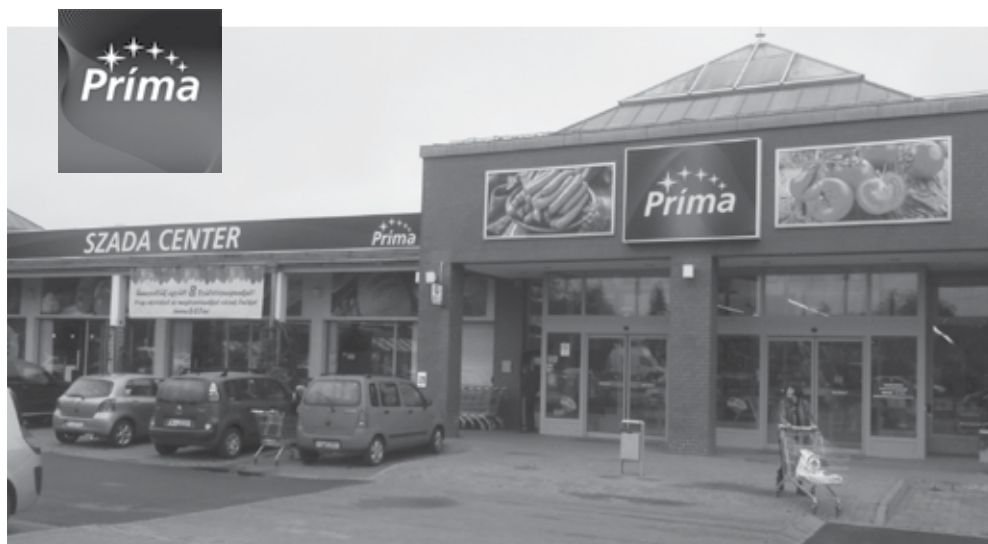
A 8. születésnapjára készülő Szada Center dekorációja nemrégiben megújult, esténként kivilágítva impozáns látványt nyújt

Az évforduló körüli időszakban, májustól június végéig zajlik a Szada Center kedvezmény kupon akciója! Az akcióban a keddi és szerdai napokon legalább 3 ezer forint értékben vásárló vevőket a pénztáraknál 10%-os kedvezményre jogosító kuponnal ajándékozzák meg, amelyeket szombat délutánonként, 12-21.30 között lehet ugyanitt beváltani. Így ha valaki hét közben is betér ide napi apróságokért, a hétvégi nagybevásárlás árának 10%-át megspórolhatja.