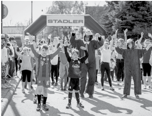
Népszerű volt a családi futás

A futóversenyen 5 különböző távon mérettethették meg magukat a sportág szerelmesei. A legrövidebb 800 méteres távon a legkisebbek ismerkedhettek meg a futóversenyek hangulatával, a 2,5 és 5 kilométeres versenytávokon a szervezők pedig elsősorban a kezdő futóknak kívántak teljesíthető, de mégis felkészülést igénylő kihívást nyújtani. A 10,5 kilométeres versenyben a középhaszadó futók találhatták meg maguknak a testhezálló kihívást, míg az esemény királykategóriája a félmaratoni versenytáv volt, amely a kimondottan meleg és napsütéses napon komoly kihívás elé állította a versenyzőket. Az eseményre 149 településről ér-