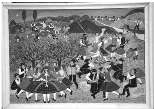
Vankóné Dudás Juli alkotása

A Falunaphoz és a díjátadóhoz idén is számos egyéb program kapcsolódik a településen működő civil szervezeteknek köszönhetően. 20-án a sporté lesz a főszerep: a sportpályán a Galgamácsai Értéktörző Egylet és Sportbarátok Köre szervezésében zajlanak majd sportvetélkedők. 21-én 10 órától 14 óráig veterán autók kiállítása zajlik, illetve a Galgamácsa és Aszód közötti főúton veterán járművek versenyét rendezik meg.