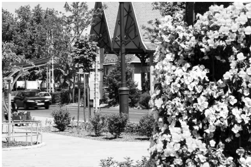
Virágokban tobzódik a város