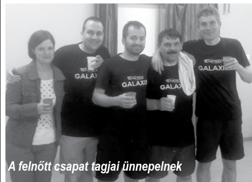
A felnőtt csapat tagjai ünnepelnek

Véget értek a Budapest-bajnokság 2014-2015. évi küzdelmei.