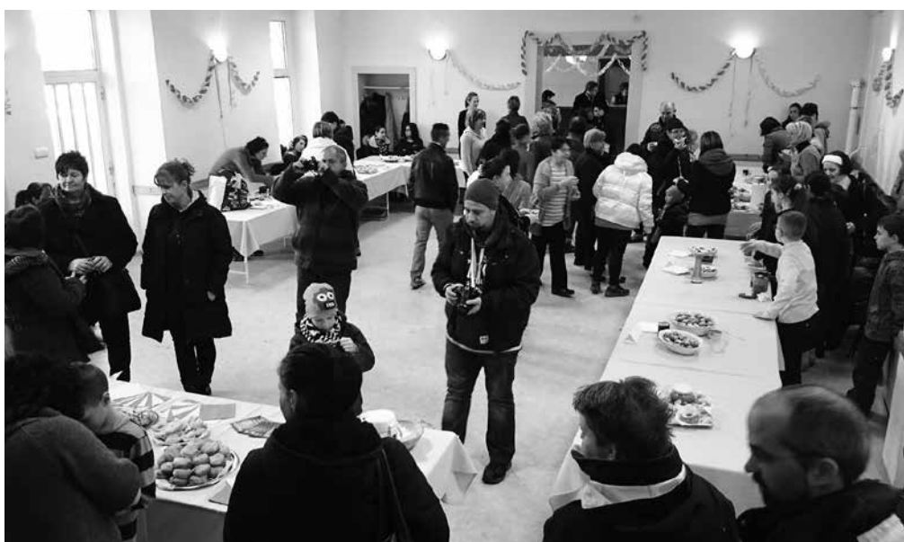
Sikeres volt az első fánkcsütő verseny!

A következő farsang már nem múlhat el vácduukai fánkcsütő verseny nélkül!