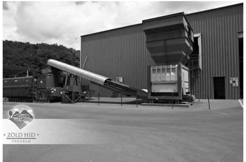
A Zöld Híd Régió Nonprofit Kft. központja az Ökörtelek-völgyben

A 2011. évben már bizonyítottuk, hogy az üzleti tervünknek megfelelően, nonprofit módon tudunk gazdálkodni. Nálunk az a nyereség, hogy az üzleti tervünkben előírt és indokolt összegeket különítünk el a jövőbeni fejlesztésekre és környezetvédelmi feladatainkra. A lerakóhelyi járulék marad 6000 Ft tonnánként, de ezt a szaktárca határozza meg, nem a szolgáltató. Érdekesként elmondható, hogy valós gazdasági hatást, pozitívumot éppen a járulék további növekedésével lehetett volna elérni, ugyanis ez esetben a csak lerakással ártalmatlanító szolgáltatók is rá lettek volna kényszerítve a vegyes hulladék mechanikai-biológiai előkezelésére. Ez nem történt meg, mert a közszolgáltatók a 2014. évben a megállapított lerakási díj töredékét tudták csak befizetni. Hangsúlyoznom kell, hogy semmilyen gazdasági problémánk