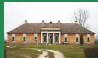
Váchartyán büszkesége lehet újra a műemlék épület