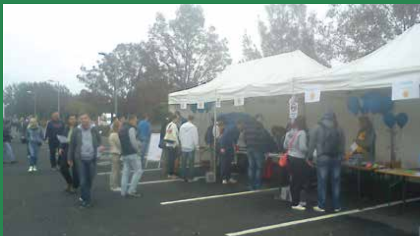
Több mint ezer embert kellett eligazítani az információs sátraknál