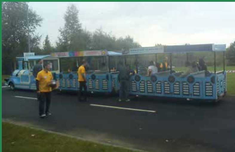
Az érdeklődőket kisonaton vitte körbe az üzemcsarnokban

Több mint ezer főt fogadni és kalauzolni egy gyárban, úgy, hogy közben zajlik a mindennapi munka is, és be kell tartani a szigorú biztonsági előírásokat, nem egyszerű feladat, de a GE munkatársai remekül megszervezték ezt a nyílt napot is. Már késő délutánra járt az idő, mikor az utolsó látogatók is kiléptek a gyár kapuján, remélve, hogy nem utoljára jártak itt, hiszen a látottak és hallottak mindenkit arról győztek meg, hogy jó ehhez a csapathoz tartozni és ebben a szellemben dolgozni.