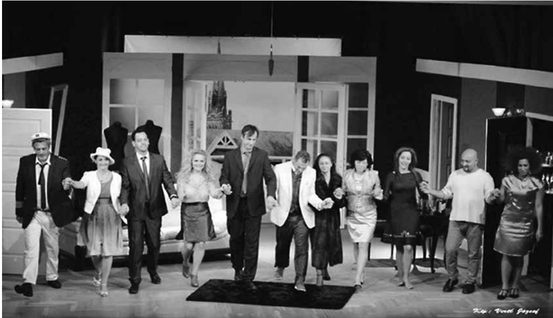
A nyugdíjasok elsőként nézhették meg a nagy sikerű előadást

A Nyugdíjas csoport vezetője és a nyugdíjasok