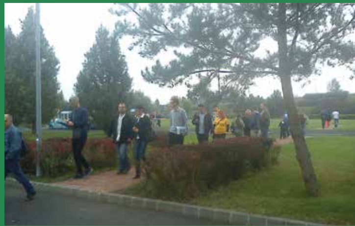
Séta a gyárudvaron

Október 4-én a szokottnál is jóval nagyobb volt a forgalom a GE veresegyházi, Kistrét utcai gyárában: ekkor rendezte lassan már hagyományosnak számító nyílt napját a vállalat, amelyen a munkalehetőségek iránt érdeklődők és családtagjaik megtekinthették magát a gyárat, és közelebbről megismerhették az itt folyó tevékenységet.