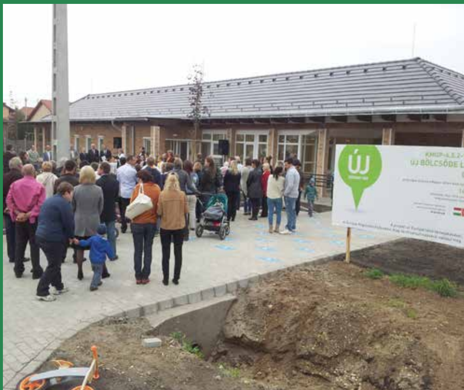
A megnyitón a leendő bölcsisek is örömmel vettek részt