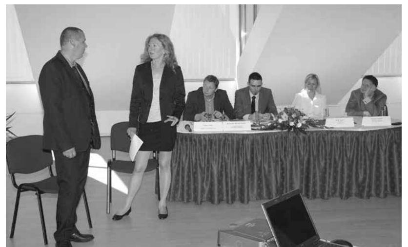
Élő interjú az első Pénzügyi-Tanácsadói Konferencián