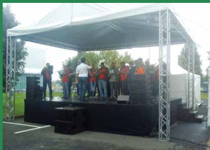
A szórakozásról is gondoskodtak a vendéglátók

Ez a kilátásba helyezett megbecsülés és életpálya, a GE, mint munkaadó jó híre sok embert vonzott a nyílt napon: 1085 fő regisztrált a különböző munkalehetőségek iránt érdeklődve. Az előadások végeztével mind-