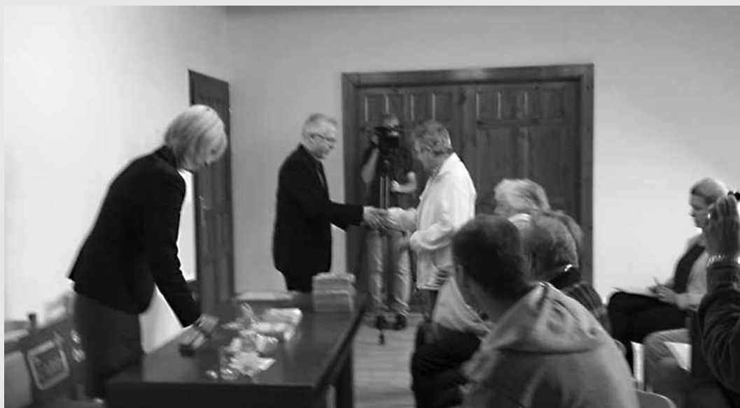
Az első kártyák átadása

A kártya az első 2000 tulajdonosának egy fillérébe sem kerül az önkormányzat jóvoltából, legalábbis az első 18 hónapban, ekkor kell majd a leletkezelő szolgáltatást megújítani. A kártyákat a lakosság a polgármesteri hivatalban igényelheti.