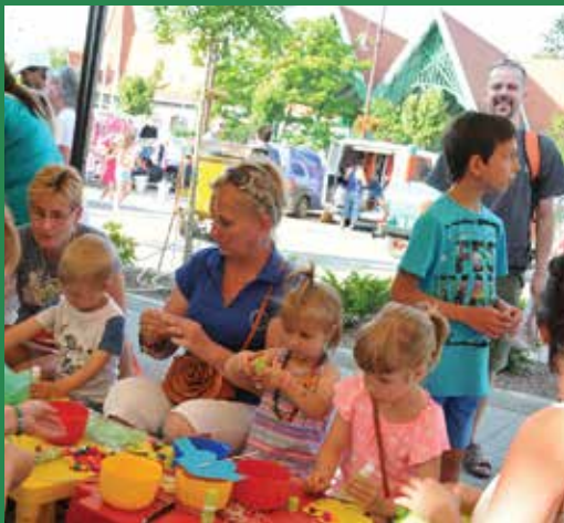
Kis kézműveskedés a városévforduló programjai között