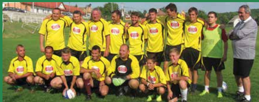
A Sebő János Ifjúsági Labdarúgó Emléktorna résztvevői