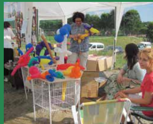
A vasárnapi családi program elmaradhatatlan része volt a lufihajtogatás

Vasárnap a sport és a családi programok álltak a középpontban: futball, judo bemutató, gyermekelőadás, táncház szórakoztatta a közönséget.