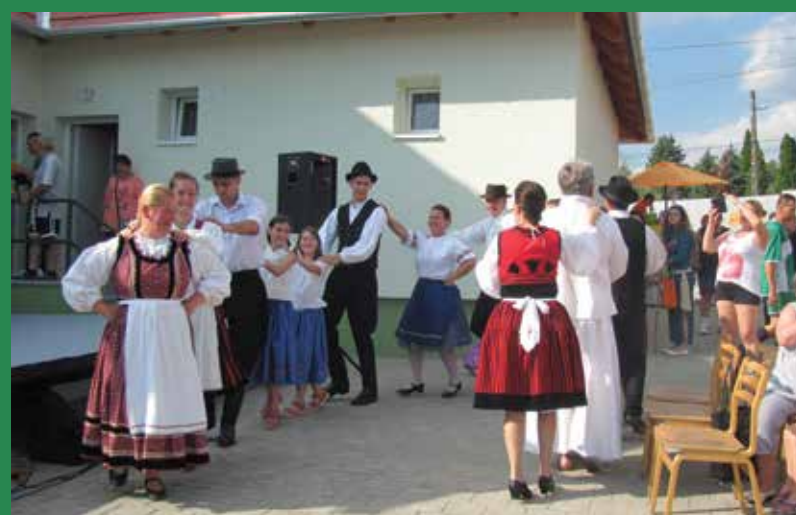
Bokréta táncház lelkes résztvevőkkel