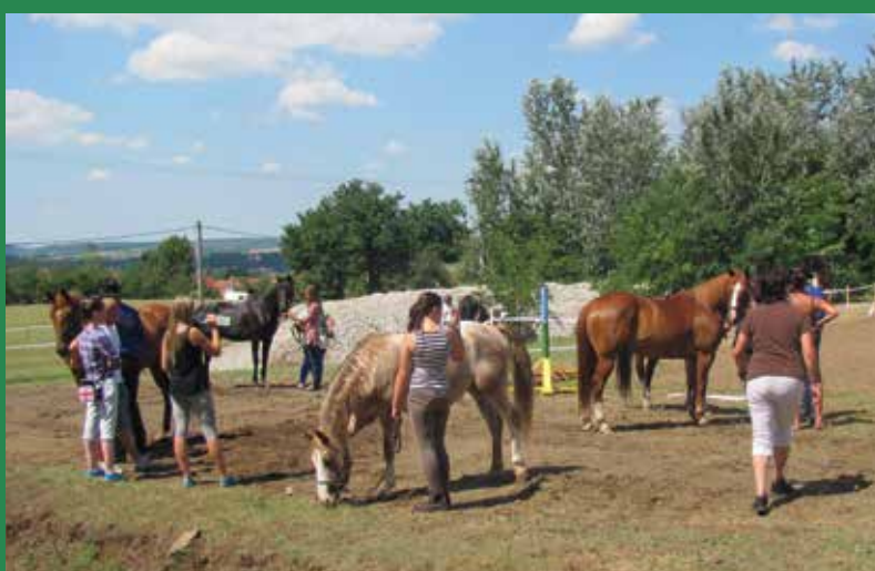
A szombati Lovas Kupa résztvevői