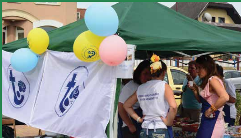
A Veresegyház és Vidéke Takarékszövetkezet csapata ezúttal süteményekkel remekelt és került az első helyre