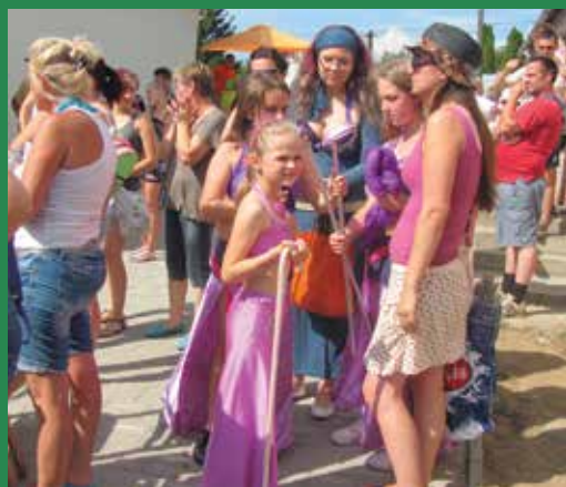
Tündérek a mesejátékból