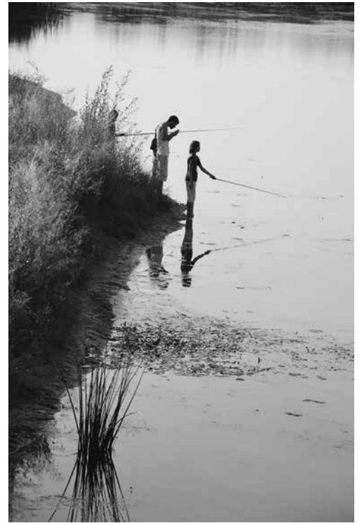
Veresegyház a tavak városa is, már feltöltés alatt áll az Álom-hegyi-tó is

Olvasóink jelzései szerint egyre inkább tó formájú és igazi vizes élőhely az „új veresegyházi tó”, a szadai határ felé eső ún. Álom-hegyi víztározó. A látszólagos fejlődés fontos és a természet szempontjából kiemelt jelentőségű: a megjelenő vízmadarak és vízi növények az egyensúly kialakulását jelzik. A tó feltöltése, kotrása, és a védművek, pl. a gát megépülése viszont még egy hosszabb távú feladat, amiről következő lapszámunkban tudunk beszámolni, a szakemberek nyári szabadságolása miatt.