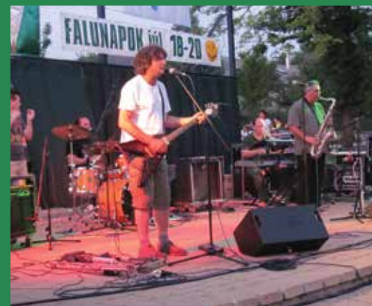
Szombat esti Madarak koncert