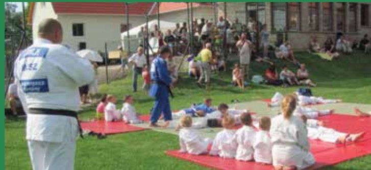
Judo bemutató a vasárnapi sportnapon