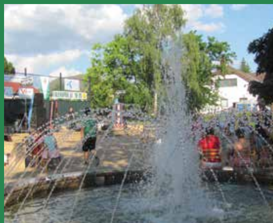
A júliusi forráságban sokan leltek enyhülést a szökőkút mellett