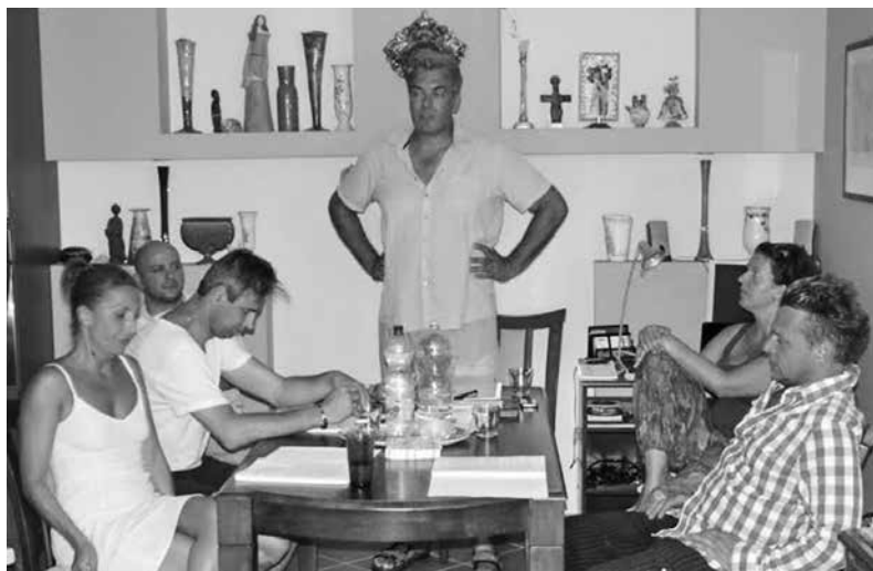
Olvasópróba a társulattal.