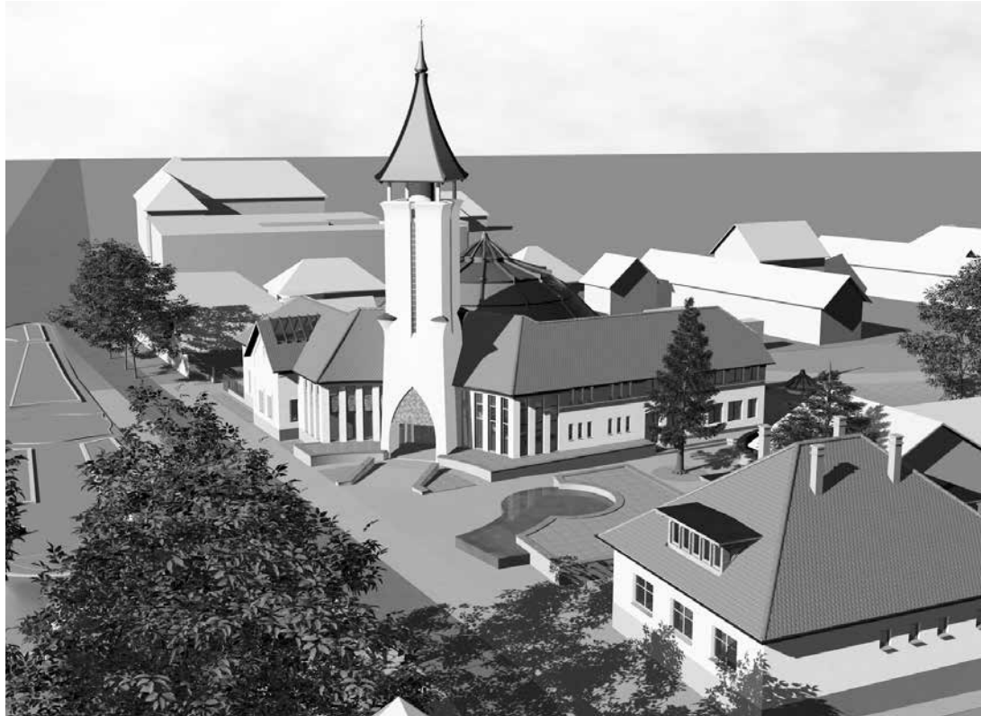
Látvány a Szent Erzsébet templom felől