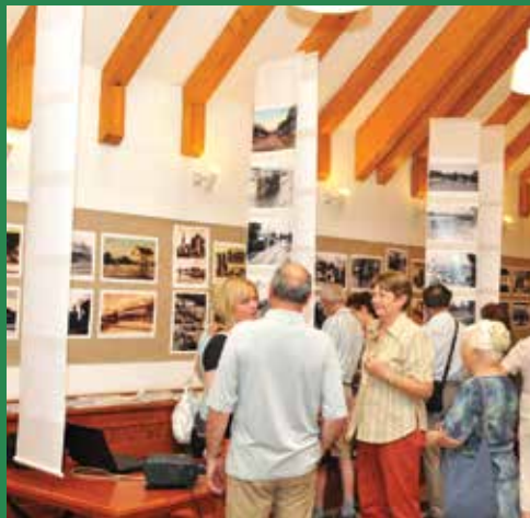
A városról a városiak által készített életképek kiállításának megnyitója

Három napos programsorozattal ünnepelte Veresegyház várossá avatásának 15. évfordulóját. Június utolsó hétvégéjén több helyszínen zajlottak a programok: a Mézesvölgyi Általános Iskola aulájában vasútmodell-kiállítás volt, a Fő téren felállított színpadon helyi művészeti csoportok és igazi sztárok is felléptek, napközben főzőverseny zajlott a Városháza előtt, az Innovációs Központ konferenciatermében pedig a város történetét megörökítő fotókiállítás nyílt. Képeink néhány eseményt örökítenek meg, ahogyan Lethenyi László kamerája látta.