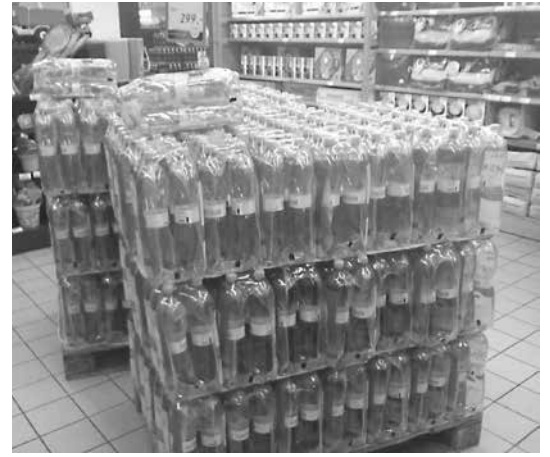
Hűsítő látvány a hőségben

A nyár további részében is folytatódnak a nemrégiben felelevenített bevásárló hétvégék két Centerben, Szadán, illetve Veresegyházon, amikor rendkívüli akciókkal, nagyon kedvező árakkal várják a vásárlókat a hétvégi nagybevásárlás idején. Az akció felváltva zajlik a két üzletben, Szadán legközelebb augusztus 9-10-én használhatjuk ki előnyeit, ami nemcsak a szuper kedvezményekben nyilvánul meg, hanem beválthatók a 20%-os kuponok is a nem akcióos termékekre. Mindkét napon árubemutatókkal, étel- és italkös-