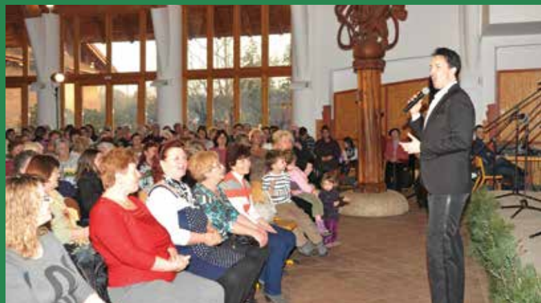
Oldott hangulat a városi nőnap ünnepségen