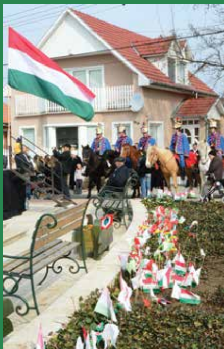
Huszárok a Petőfi téren