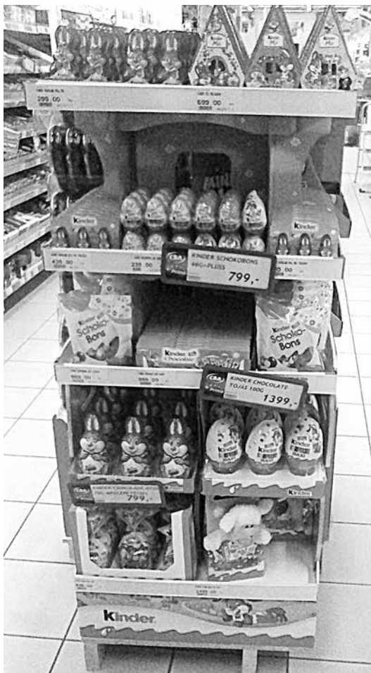
Minőségi nyuszik, tojások, házikók Húsvétra

A jelenlegi épület megvásárlásával az önkormányzat csak a sürgős igényeket tudja kielégíteni.