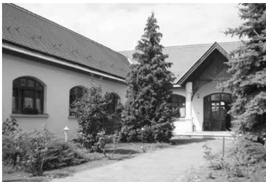
Az Idősek Otthona továbbra is minden helybélit befogad

f/ A 29/1993. (II.7.) Korm. rendelet a személyes gondoskodást nyújtó szociális ellátások térítési díjáról szóló 29.§ (3) bekezdése szerint a térítési díjat az élelmezésre fordított költségekkel csökkenteni kell, ha az ellátott az étkezést nem veszi igénybe. Az étkezés napi költsége 737 Ft/nap, egy hónapra 22 110 Ft.