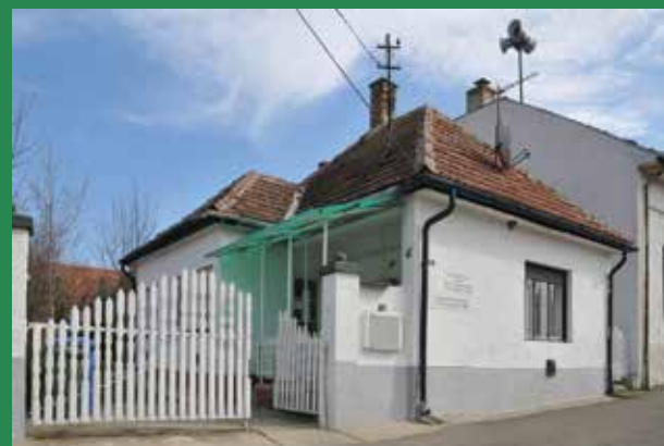
Esély Szociális Alapellátó Központ épülete