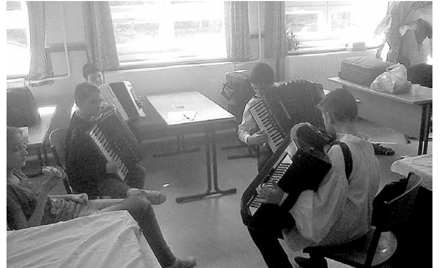
Harmonikások a népzenei bemutatóra készülve