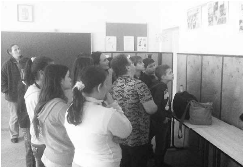
Ismerkedés a hagyományokkal képek segítségével