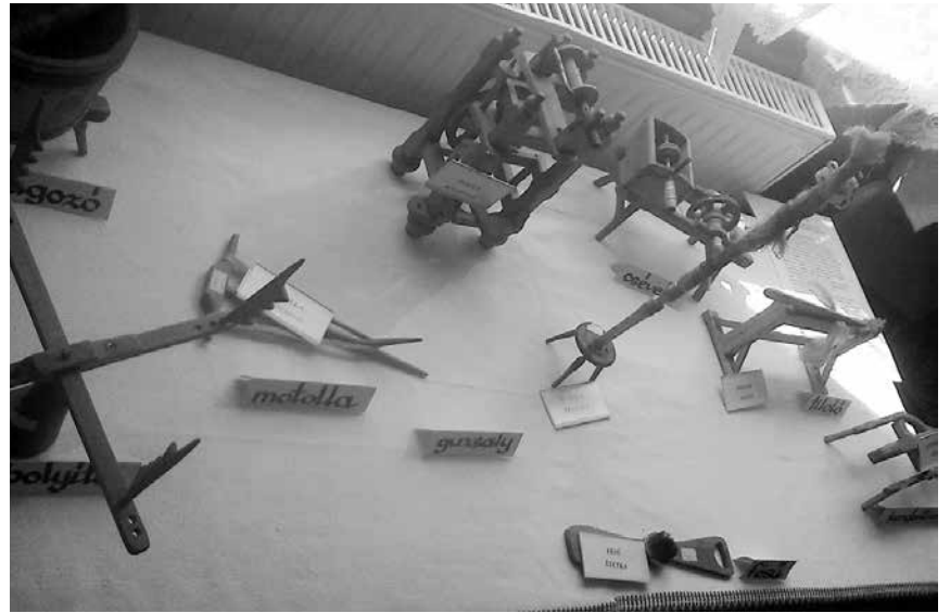
Hajdani kézműves eszközök makettjeivel ismerkedtek a diákok