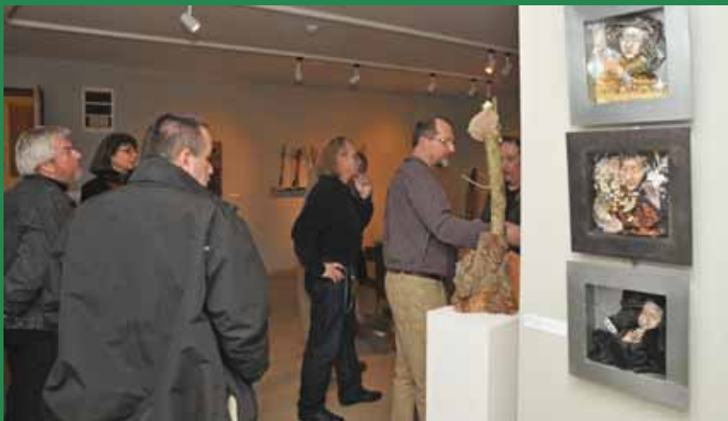
A Gömb kiállítás szakmai közönsége