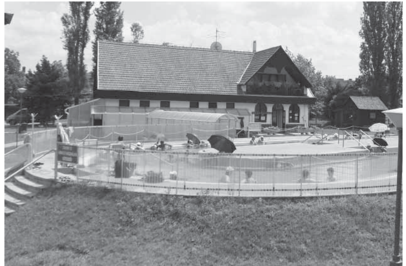
Sok évig így ismertük a veresi termálfürdőt. Az új fürdőben több szinten egyszerre 500 vendég fér majd el

Az új veresegyházi termálfürdő terve ezzel az egyeztetéssel tovább haladt a megvalósítás felé, ami Pásztor Béla szavaival élve az első lépés abba az irányba, hogy Veresegyház termálvárossá váljon.