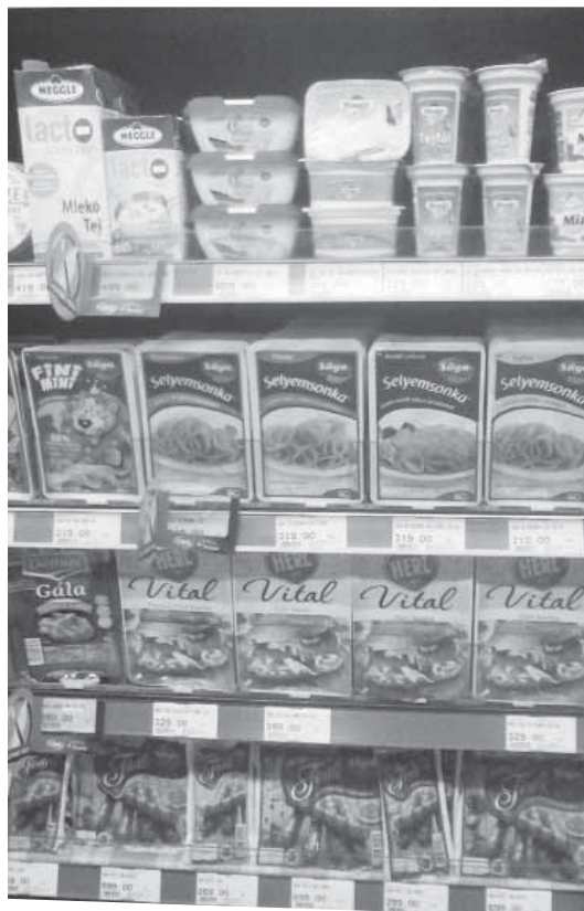
Jól ismert árucikkek is megfelelnek a modern követelményeknek

Úgy tűnik, idén korán tavaszodik, ám a jó idő mégsem jött túl korán ahhoz, hogy megelőzze a térségi CBA üzleteket, melyek mindegyike árusít már virágföldet, vetőmagokat, rózsatöveket. Minden segítség adott tehát ahhoz, hogy időben elkezdjük a kertészkedést, és a telek,