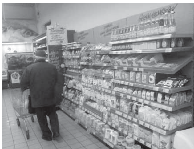
Egészséges és korszerű reform élelmiszerek

Húsvét alkalmából pedig már idejekorán, március elején megjelennek a csokinyuszok és csokoládé tojások, díszek, tojásfestékek, és március első hetétől már a különböző minőségű sonkák között is válogathatunk ízlésünk és pénztárcánk szerint. A hagyományos, hosszú érlelésű, házi füstölésű termékektől a gyorspácolt sonkáig idén is széles lesz a választék!