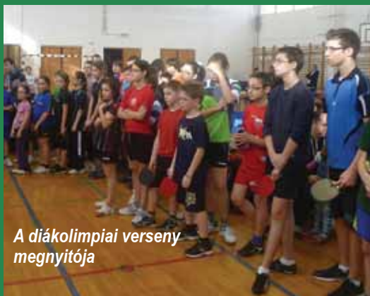
A diákolimpiai verseny megnyitója