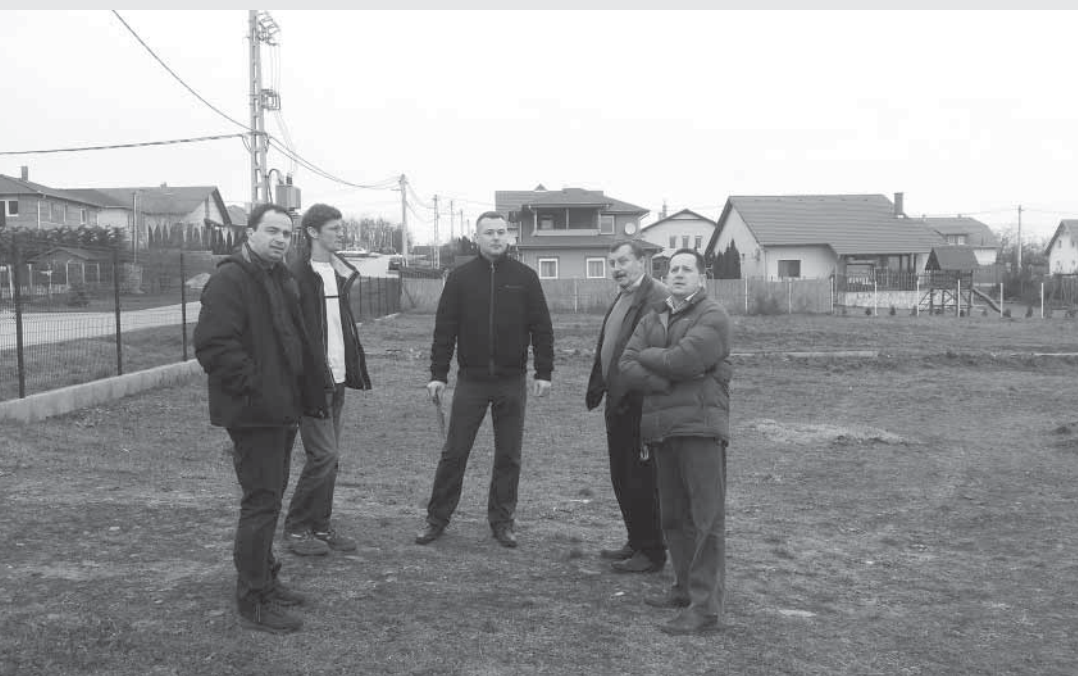
Klement János polgármester és a kivitelezők a beruházás ünnepélyes indításakor

2014. január 14-én kezdődtek és várhatóan augusztus 30-áig tartanak az építési munkálatok. Az új bölcsőde építése és a hozzá kapcsolódó eszközbeszerzés együttesen teszik lehetővé a hosszútávon fenntartható minőségi ellátás biztosítását. Az elhelyezési gondok megoldásával megteremtődik a kisgyermekes szülők munkakerőpiacra történő visszaintegrálásának előfeltétele, bővül a település intézményi infrastruktúra