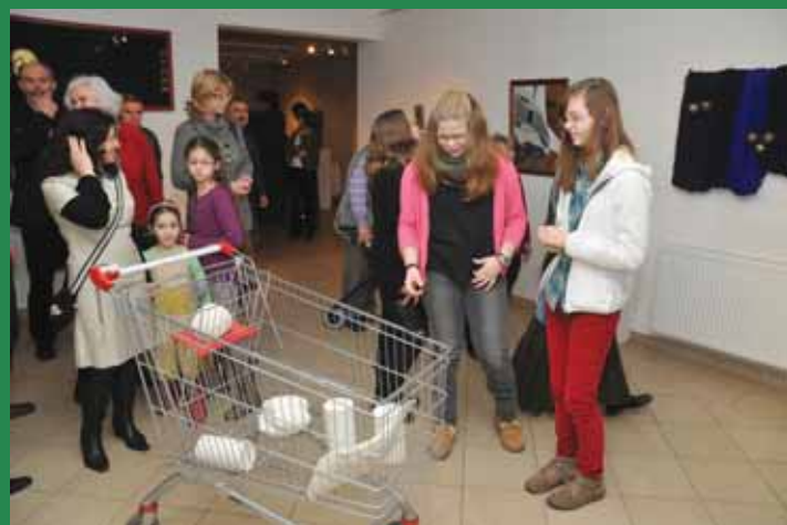
Szokatlan installáció a középontban