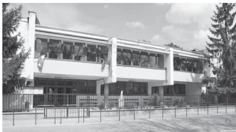
Az idei fejlesztési tervekben is szerepel az iskola

Ha marad pénztartalékunk, azt az utak felújítására, a korábban megkezdett részekre az utak aszfaltozására szeretnénk fordítani, és ami szintén nem elhanyagolható: a településen már megszokottá vált, színvonalas rendezvények folyamatát szeretnénk támogatni továbbra is.