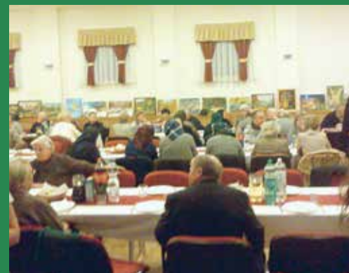
Idősek Napja Csomádon