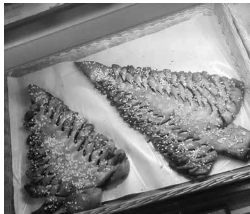
Készülnek a karácsonyi kalácsok

Veresegyházon a Veres Center parkolójában Karácsonyig ismét van fenyőfavásár, Szilveszter előtt pedig tűzijátékok is vásárolhatók a Veres Center és a Szada Center előtt.