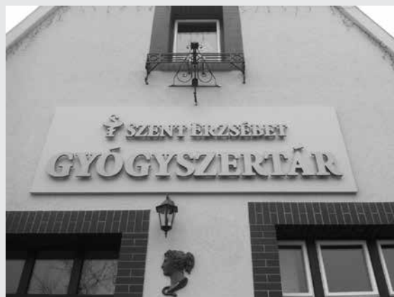
Megszépült az évszázados épület

A város legidősebb gyógyszertárának hirdetését ld. a hátsó borítékon!