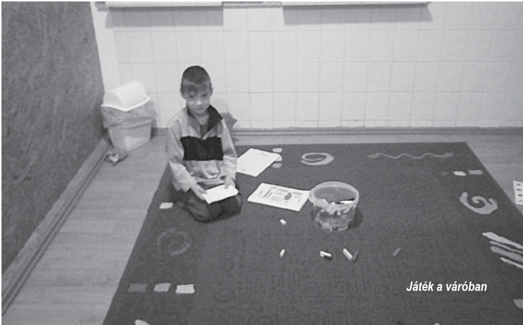
Játék a váróban