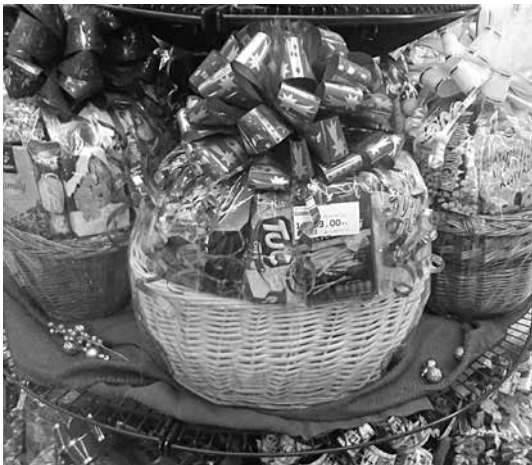
Kész ajándékosarak közül is választhatunk

A boltokban karácsonyig egymást érik majd a különböző akciók, lesznek időszakok, amikor