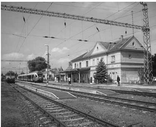
Néha felbukkan az új szerelvény Veresegyházon

Utoljára három évvel ezelőtt írtunk a MÁV több évre szóló korszerűsítési terveinek részleteiről. Ezzel kapcsolatban a legújabb fejlemény, hogy a 71. számú Budapest-Veresegyház-Vác vasútvonal elővárosi célú fejlesztéséhez szükséges engedélyeket megkapta a Nemzeti Infrastruktúra Fejlesztő Zrt. Ezúttal az iránt érdeklődtünk, mi valósul meg a tervekben, illetve mik a fejlesztés következő lépései. Természetesen Olvasóink gyakori kérdéseire is igyekeztünk választ kapni a társaság kommunikációs igazgatóságától.