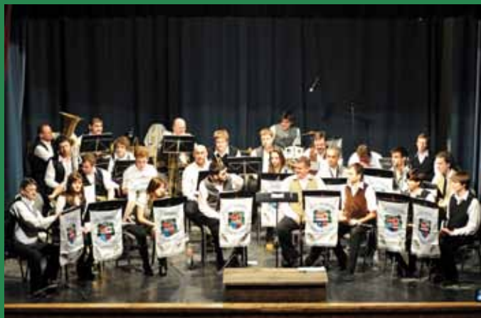
A Veresegyházi Fúvósok farsangi koncertje