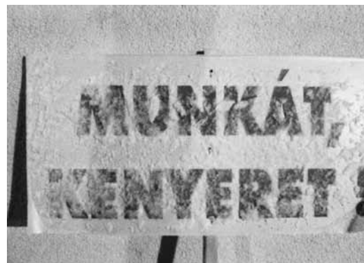
Az éhségmenet táblája

Az a helyzet, hogy azokra a kérdésekre, hogy "miért nem mennek dolgozni?", az a válaszom, hogy pl. vannak fálvak, ahonnan 40 km-re van az első munkahely, pl. Miskolc. Másik pedig, hogy sokan egyszerűen nem is láttak maguk körül munkába járó embereket, őket be kellene vezetni a munka világába, különböző eszközökkel.