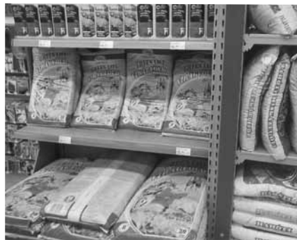
És megannyi vetőmag, virágmag, amiket elültethetünk