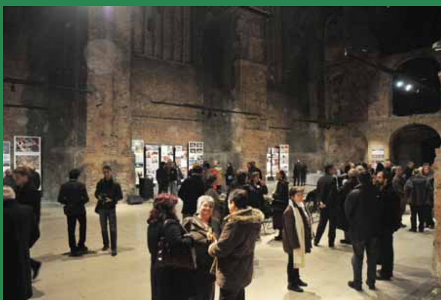
A kiállítást Veresegyházról is sokan megnézték

Február 16-án szokásos farsangi koncertjét adta a művelődési ház színpadán a Veresegyházi Fúvósenekar.